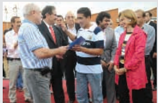
|| PRENSA IPV