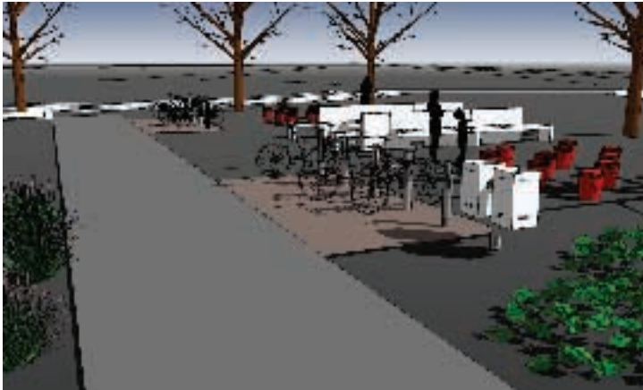
▲ Punto de encuentro