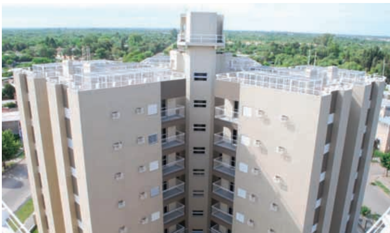
▲ Torres del Sur, sobre calle Independencia, barrio Cabildo, ciudad capital de Santiago del Estero, 2010

La institución, a la vez de realizar construcciones de unidades habitacionales para satisfacer la necesidad de contar con el techo propio, también lleva a cabo obras de infraestructura, espacios verdes, equipamientos comunitarios y edificios en altura, como las Torres del Sur.