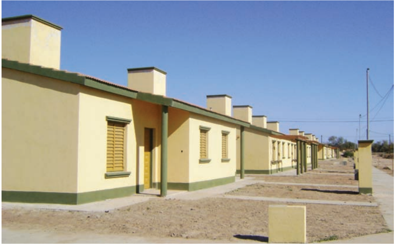
▲ Una de las tipologías de viviendas del barrio Campo Contreras

INSTITUTO PROVINCIAL DE VIVIENDA Y URBANISMO