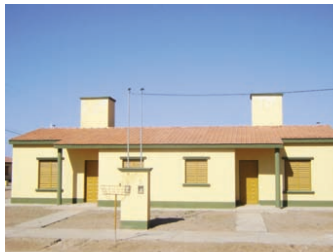
▲ Tipología de vivienda barrio Campo Contreras