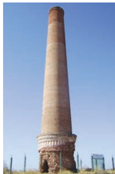
▼ Emblema histórico: una de las actuales chimeneas del por entonces ingenio Contreras.