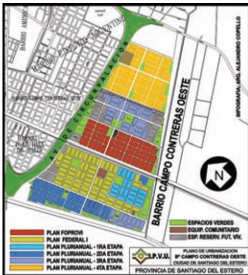
▲ Infografía barrio Campo Contreras OESTE Arq. Alejandro Copello

que, para este proyecto de tamaño envergadura, a partir de la ejecución de los programas federales se diseñaron variados prototipos de viviendas y comenzaron a implementarse las tipologías de viviendas especiales para grupos familiares con algún integrante discapacitado, cuyos cupos constructivos se previeron en un 5% de cada licitación de obra.