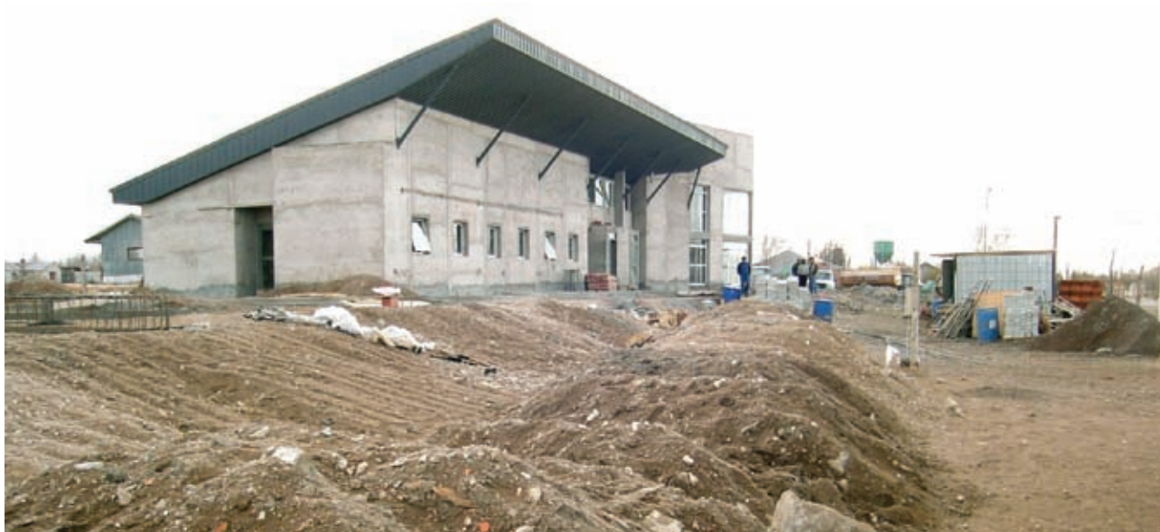
▲ Estación Bimodal Menucos