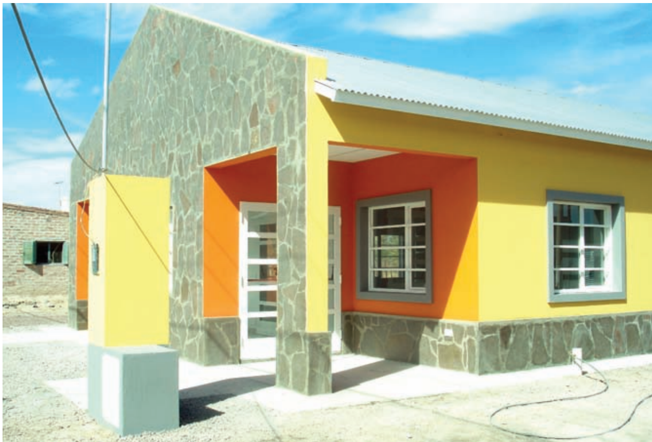
▲ Parador Ramos Mexía

antecámara a un hall distribuidor, un salón comedor y de estar con servicios de cocina y lavadero, baños públicos y cuatro dormitorios cada uno con baño privado.