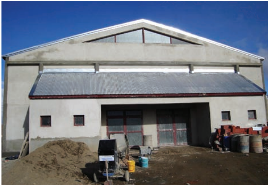
Polideportivo Menque ▲

INSTITUTO DE PLANIFICACIÓN Y PROMOCIÓN DE LA VIVIENDA