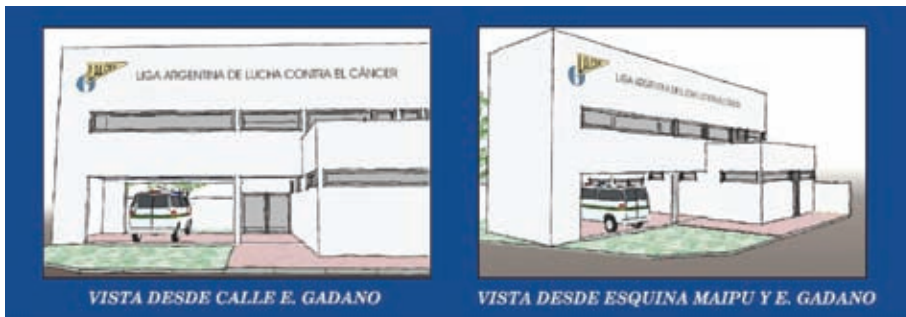
VISTA DESDE CALLE E. GADANO