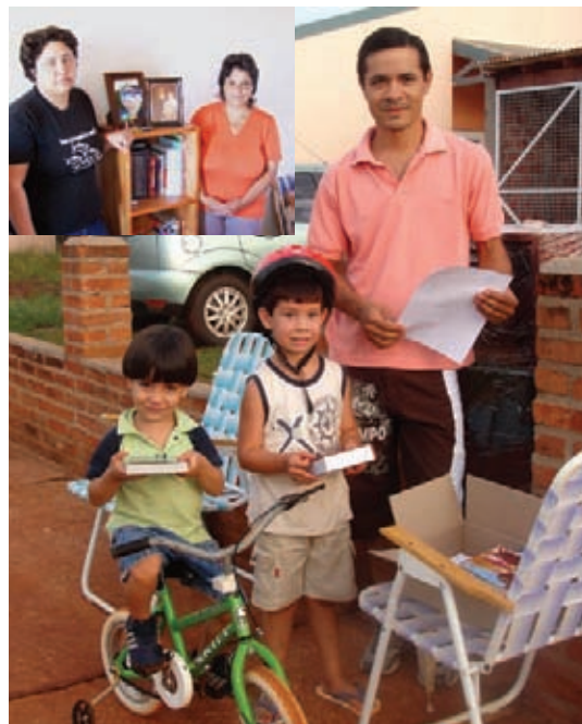
▲ Bibliotecas - Por el Plan Libros y Casas, los niños reciben sus libros