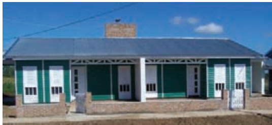
63 viviendas en inicio de obra. Inversión: $ 7.812.000.