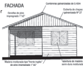
Contratación e inicio de la 1° etapa de 400 viviendas. Inversión: $ 20.000.000.