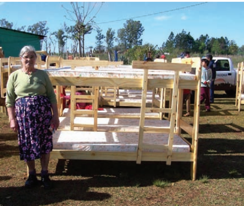
Plan Cucheta ▲

INSTITUTO PROVINCIAL DE DESARROLLO HABITACIONAL (IPRODHA)