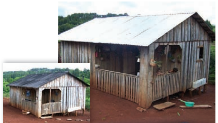
1.500 cerramientos en contratación e inicio. Inversión: $ 2.550.000.