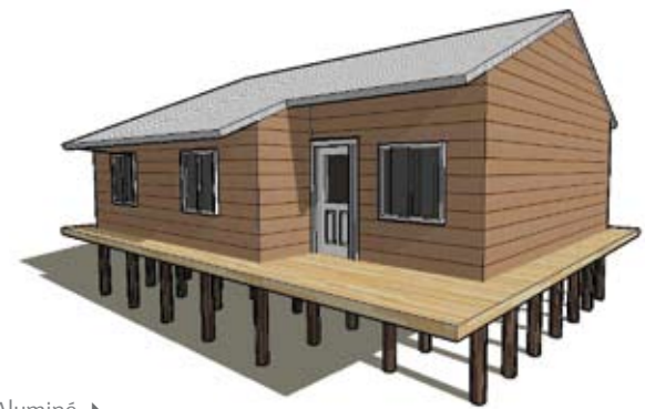
14 viviendas Aluminé ▶