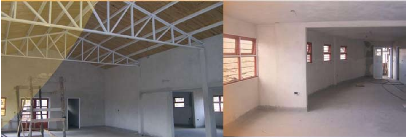
▲ Programa de Infraestructura Comunitaria

Subsecretaría de Vivienda de la provincia de Neuquén Agencia de Desarrollo Urbano Sustentable Dirección General del Plan Social de Desarrollo Urbanístico