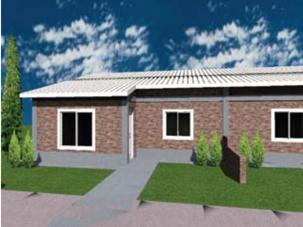
▲ 12 viviendas Las Lajas

AGENCIA DE DESARROLLO URBANO SUSTENTABLE - A.D.U.S.