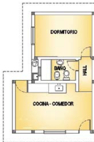
▲ Planta Prototipo Bella Vista

y el sector social asistiendo en forma integral a cada familia.