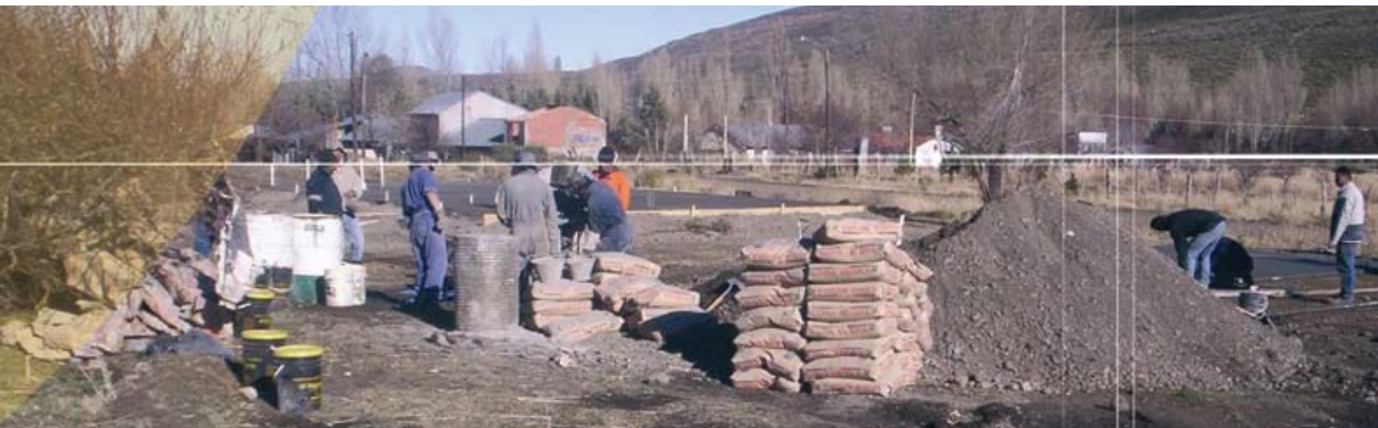
▲ 15 viviendas en Andacollo (localidad del interior de la provincia de Neuquén)

dos dormitorios con las siguientes características: estructura antisísmica a nivel de toda la superficie cubierta empleando sistemas tradicionales y no tradicionales (industrializada en troncos) e instalaciones sanitarias, eléctricas y de gas con materiales normalizados. Los materiales a emplear se adaptan según la zona, así como también las aberturas y la definición en los techos.