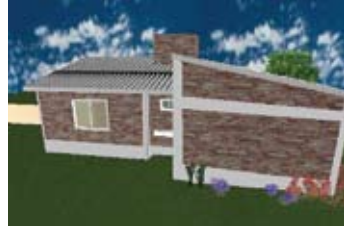
▲ 71 viviendas Bella Vista