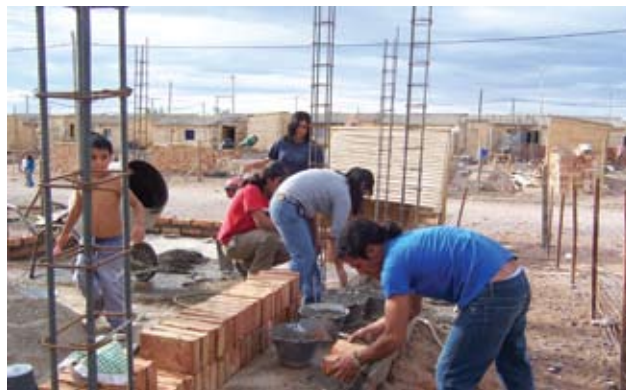
▲ ▼ 47 viviendas en Neuquén capital. Actual barrio 20 de Septiembre

Las superficies de dichas viviendas rondan entre los 50 y los 60 m 2 . La modalidad de trabajo es con ayuda mutua desde el inicio hasta el final de la obra. La participación de mano de obra contratada es mínima y se da en tareas específicas como electricidad, plomería y gas. Nuestro equipo de trabajo tiene en ejecución 125 viviendas por autoconstrucción asistida. Estamos trabajando y elaborando una propuesta habitacional que integre tecnología y modalidad de ejecución que sustente el trabajo técnico, social y administrativo al servicio de la autoconstrucción.