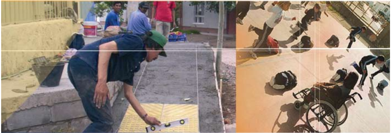
▲ Programa de mejoramiento de la calidad de vida a vecinos con capacidades diferentes

falta de mensuras y de regularización dominial, carencia o inadecuada infraestructura recreativa, cultural, deportiva y/o de desarrollo socio-comunitario, a través de la ejecución de un conjunto de obras y servicios que faciliten la consolidación barrial y la organización social.