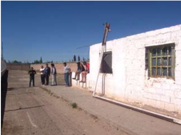
▲ Programa Recuperando Soluciones