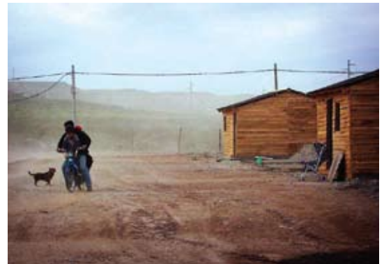
◀ Programa de Urbanización Lote Z1