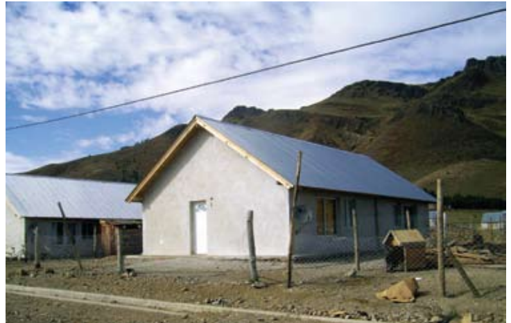
▲ 12 viviendas en San Martín de los Andes