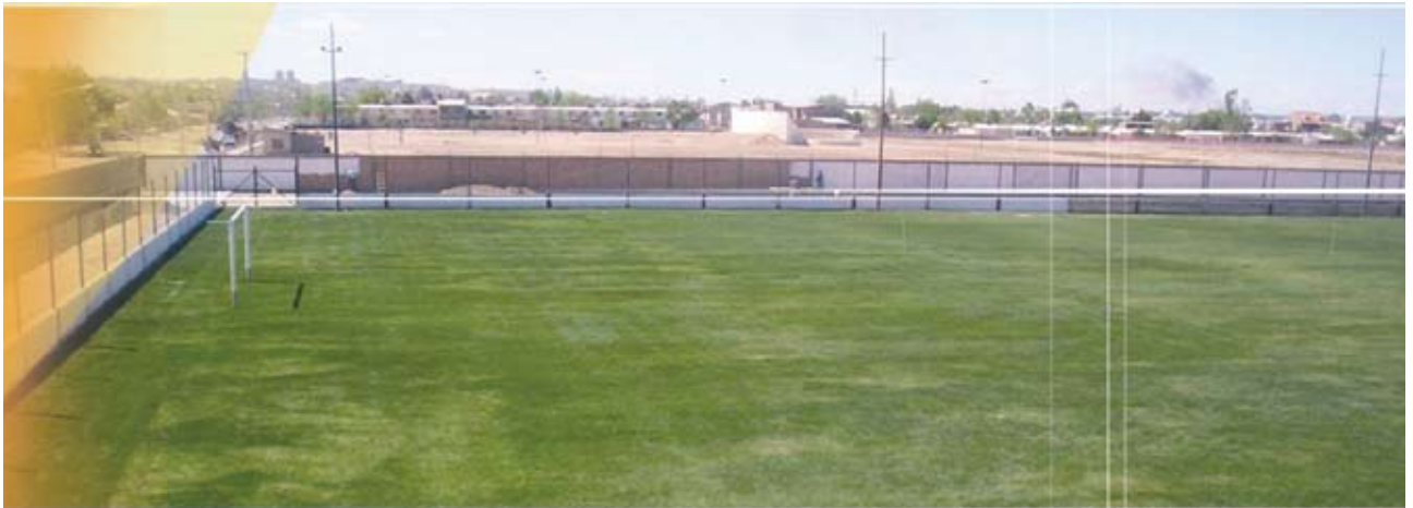
▲ Programa de generación y/o consolidación áreas deportivas