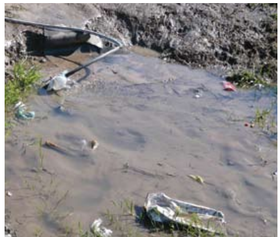
◀ ▲ Áreas en proceso de crecimiento inhabilitadas ambientalmente por proximidad a lagunas de oxidación y precariedad de las infraestructuras

La complejidad de los problemas de crecimiento de las localidades provinciales demanda una nueva política pública que oriente la dimensión territorial de los municipios, promueva la articulación de actores y coordine el accionar de los programas y proyectos.