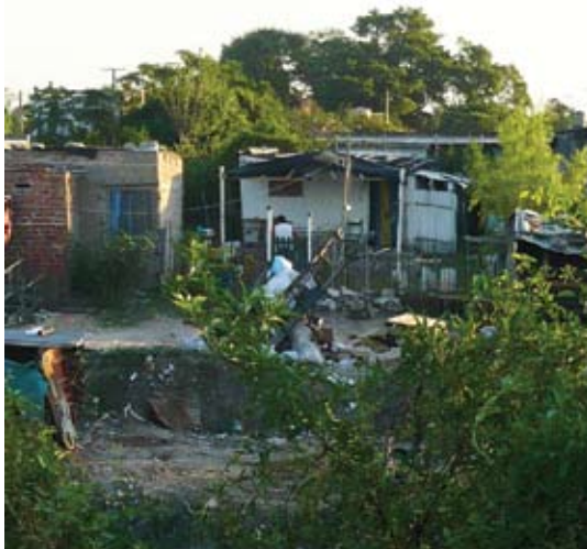
Áreas vulnerables y de difícil accesibilidad ▲

proyección de las soluciones de infraestructura básica, vivienda, sistemas viales y saneamiento ambiental. Los instrumentos básicos a utilizar serán los planes directores urbanos y el proceso de microlocalización de inversiones.