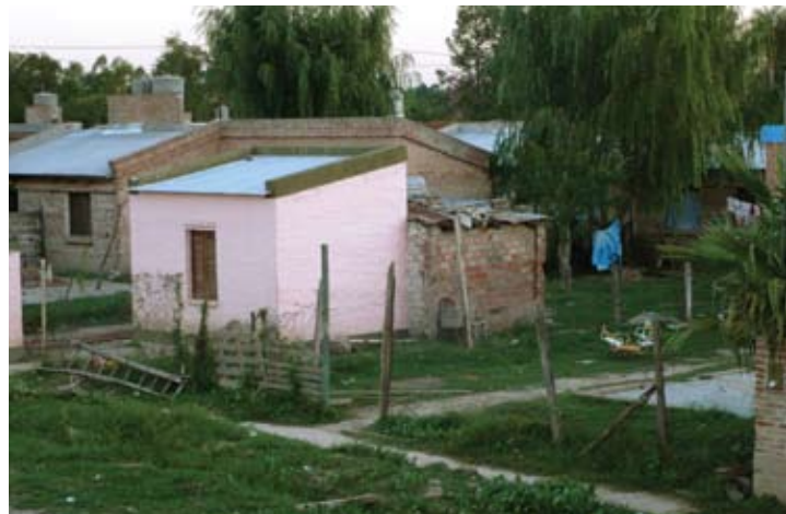
▲ Áreas urbanas con problemas y potencialidades específicas