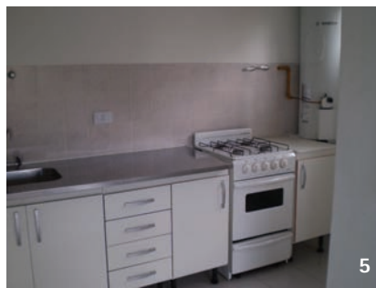
1, 2, 3, 4 y 5 ▲