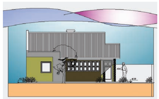
▲ Fachada principal