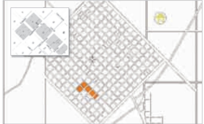
▲ Ciudad de Victoria: ■ Barrio Fortinera del Resina