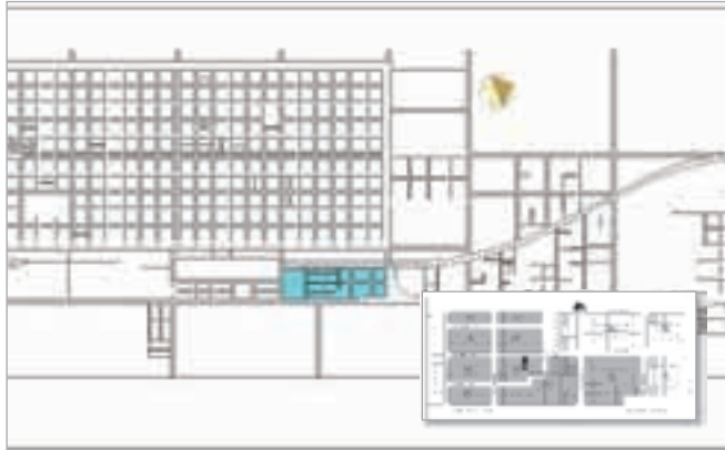
▲ Ciudad de Toay: ■ Barrio San Martín