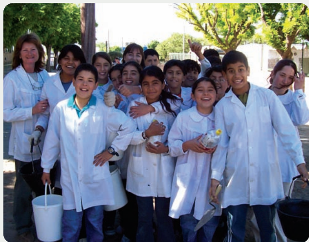
▲ Taller de "Reciclado de pilas" con alumnos de la Escuela N° 172 del Barrio M. Larraburu (Gral. Acha).