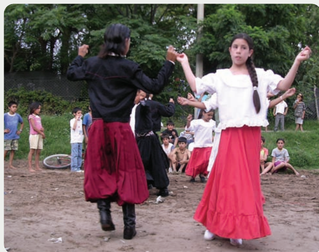
▲ Festejo de Fin de Año en el Barrio Zona Oeste Quintas II (Santa Rosa).