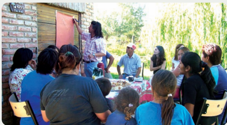
◀ Taller de Uso y Mantenimiento de Núcleos Húmedos junto a vecinos del Barrio Zona Oeste Quintas II.

El trabajo que se realiza desde las diferentes áreas posee un carácter particular de intervención: Integral, porque debe tener en cuenta todo ese fenómeno complejo y multifacético que es la pobreza. Integrado, porque era necesario terminar con los compartimientos estancos de cada organización, de cada programa, que persiguen, cada cual por su lado, objetivos aislados. La consolidación del equipo de intervención como tal es un factor insoslayable que asegura resultados exitosos. Esta consolidación pasa, entre otros factores, por la comprensión e integración de los distintos enfoques (social, ambiental, legal y de obra). Es decir, que se toquen los aspectos sustanciales y sus relaciones, sobre los que se operará permitiendo una visión conjunta de la realidad que se ha de abordar. “Una vivienda no sólo es estar bajo techo, es básicamente un acuerdo social. Satisfacer necesidades de vivienda e infraestructura social es un derecho que dignifica la vida de los vecinos”.