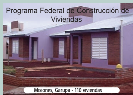
Programa Federal de Construcción de Viviendas