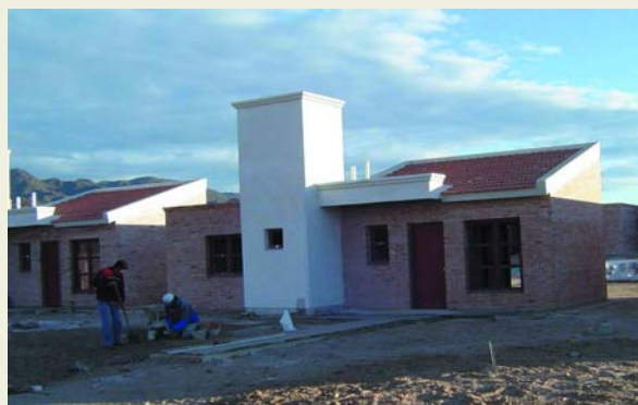
Vivienda del Programa de Reactivación II