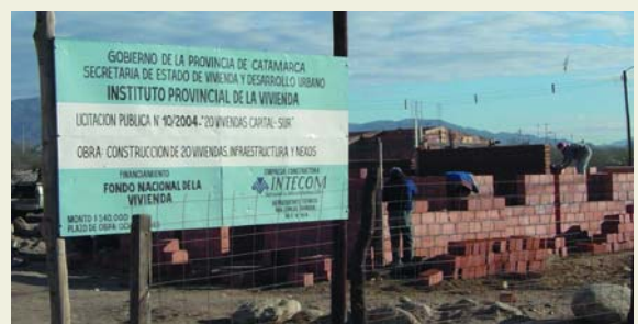
Vivienda del Programa Federal de Solidaridad Habitacional