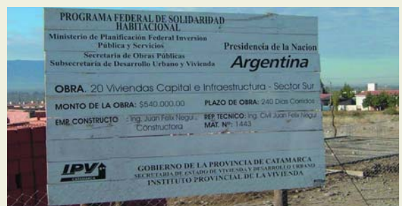
Avance de Obras del Programa Federal de Solidaridad Habitacional