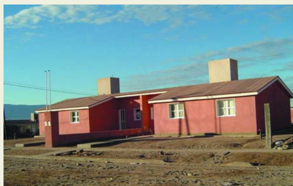
Vivienda del Programa de Reactivación I