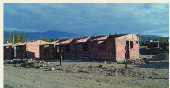
Vivienda del Programa Federal de Solidaridad Habitacional