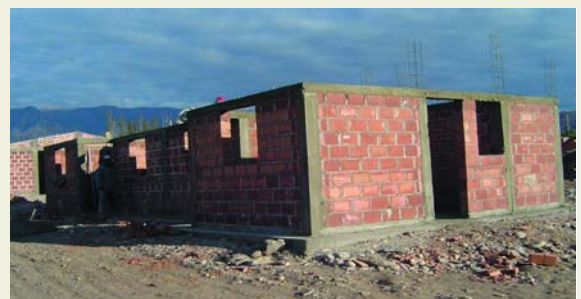
Vivienda del Programa Federal de Solidaridad Habitacional