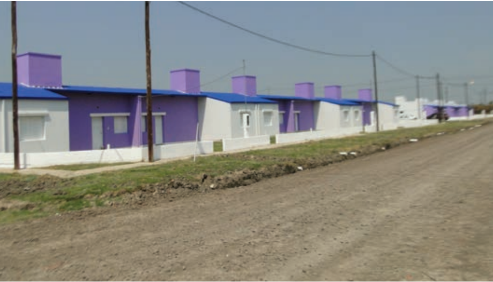
Otra vista de las viviendas 2D entregadas ▲

el barrio Evita, en la ciudad capital. En Pozo del Tigre, luego de que el pueblo fue destruido por la furia de un violentísimo tornado, se reconstruyeron las viviendas, el equipamiento social y la infraestructura de esa localidad.