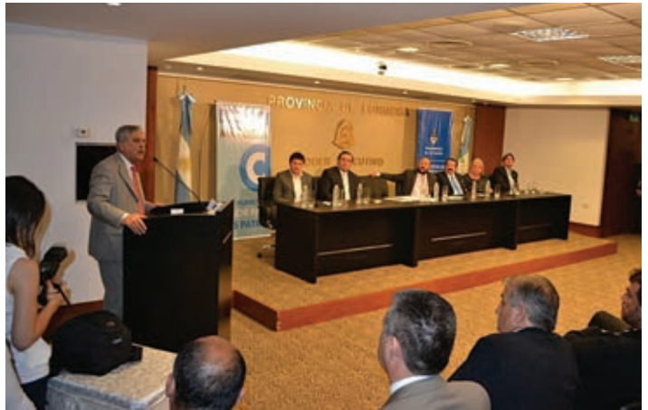
▲ El arquitecto De Vido anunciando las obras

El gobernador Gildo Insfrán y el ministro de Planificación Federal, Inversión Públicas y Servicios, arquitecto Julio De Vido, presidieron un acto el 7 de octubre pasado donde acordaron el inicio de un importante paquete de obras y anunciaron el llamado a licitación de otras. Se trata de realizaciones de alto impacto social a través de la cartera de Planificación, que en su conjunto demanda recursos por un monto de $ 1.285 millones.