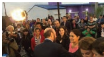
▲ Otra vista del acto