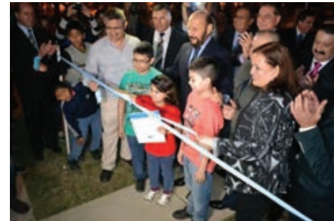
▲ Corte de Cintas con la presencia del gobernador Insfran

El desafío más importante, en ese momento, era hacer de esta política de Estado una realidad creíble