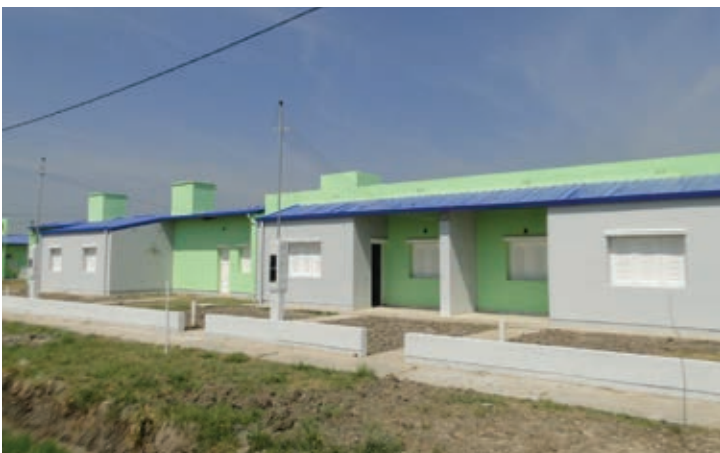
▼ Viviendas 2D entregadas en Nueva Formosa

Este proceso, iniciado hace más de 30 años, ha producido el egreso, de estas escuelas, de hermanos aborígenes con el título de MEMAS (Maestro Especial Modalidad Aborigen), que a su vez dictan clases y/o dirigen estas mismas escuelas,