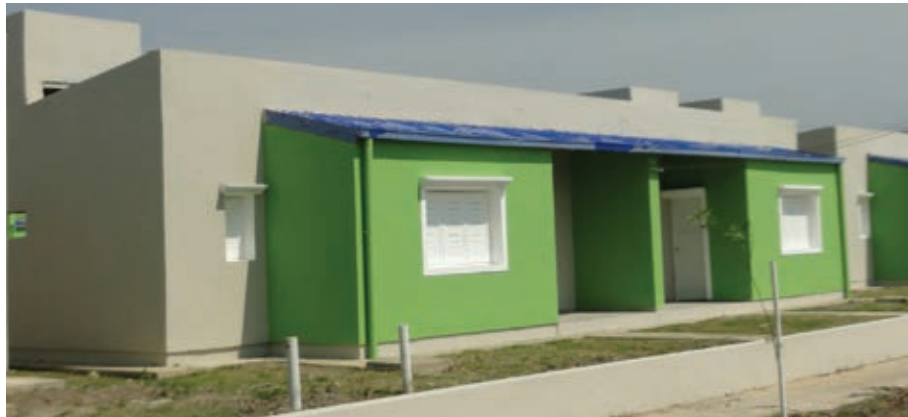
▲ Viviendas 2D entregadas en Nueva Formosa

Para completar la inclusión de este sector social, se lanzó el programa de 1.000 viviendas, cuyo objeto es la ejecución de unidades habitacionales destinadas a albergar familias de diversas comunidades aborígenes y que forma parte del plan de reconstrucción iniciado para las distintas localidades de nuestra provincia. El total de vi-