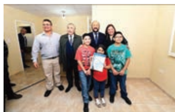
▲ Interior de las viviendas para discapacitados

Las viviendas rurales, las viviendas para los pueblos originarios, las viviendas urbanas, los planes de desarrollo urbanos, el mejoramiento de las viviendas, el mejoramiento de barrios, infraestructura y equipamiento de la capital y el interior son algunas de las realidades que fue encarando el IPV en esta etapa de evolución constante que vive la provincia.