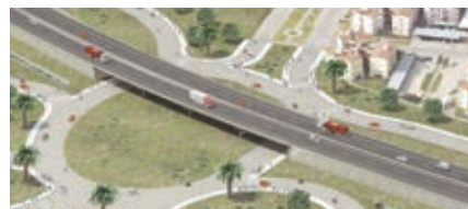
▲ Puente elevado sobre la Av. Néstor Kirchner