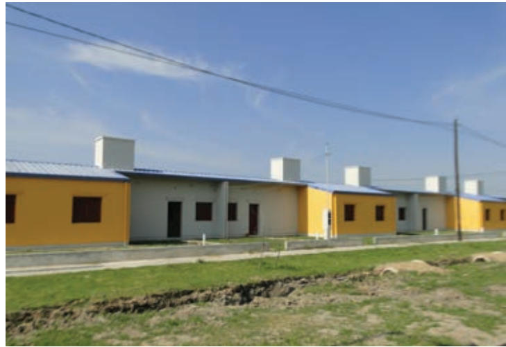
▲ Viviendas 2D entregadas en Nueva Formosa

Ello, además de concretar los aspectos centrales de la Planificación Urbana, como lograr ciudades equilibradas, dinámicas y competitivas.