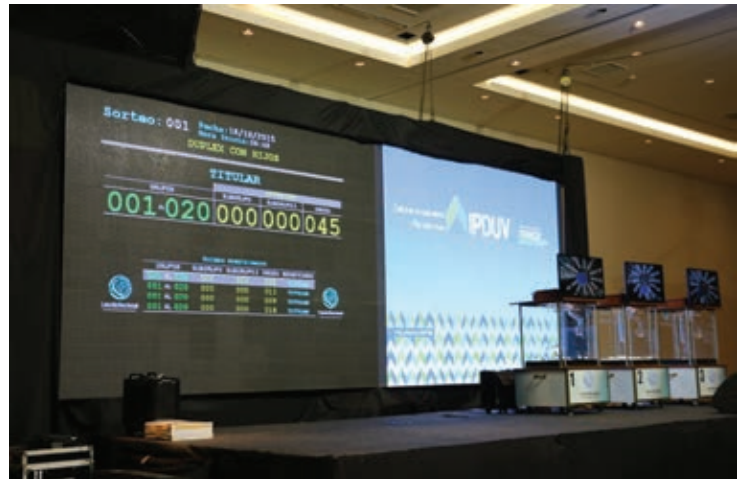
▲ Sorteo de las viviendas en Caraguatá, Resistencia, Chaco ▲ ▼

muy contentos porque dimos un paso importante para tener nuestra casa”, agregó.