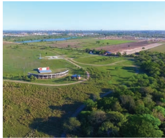
▲ Parque natural Caraguatá, Resistencia, Chaco ▲

E n la provincia del Chaco se han concretado, a lo largo de una gestión de ocho años, históricos logros en lo que respecta a la cuestión habitacional. En este sentido, serán 60.000 soluciones habitacionales ejecutadas y entregadas en diciembre de 2015, cuando Jorge Capitanich culmine su segundo mandato al frente del Gobierno provincial, y que ha significado que miles de familias chaqueñas accedieran a un techo propio y digno y con ello a una vida más segura, saludable y feliz.