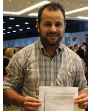
▲ Sorteo de las viviendas en Caraguatá, Resistencia, Chaco ▲

En tanto, en breve se contempla la construcción de 200 viviendas correspondientes al convenio concretado con el Consejo de Profesionales de Ciencias Económicas y están en proceso de construcción 340 viviendas del proyecto Gran Toba, que se suman a otras 100