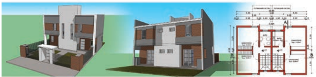
TIPOLOGÍA: DUPLEX / 2 DORMITORIOS / SUP.: 57,74 M 2

existen en el lugar, adecuando en sus áreas no ocupadas por el monte una urbanización que se integre al entorno. En este sentido, aproximadamente el 45% del área será aprovechada con el desarrollo urbanístico; el Parque se potenciará para el destino con el cual fue creado, como espacio de aprovechamiento y del paisaje natural de nuestro Chaco, con sus recursos naturales. De esta forma, se apunta a lograr un asentamiento de gran calidad paisajista con un bajo grado de alteración del medio natural y sin necesidad de ajustarse estrictamente a normativas urbanísticas, en un todo de acuerdo con las premisas de desarrollo sustentable. Al respecto, se concretará una delimitación con alambrado perimetral del bosque nativo para su resguardo de animales domésticos y de gana-