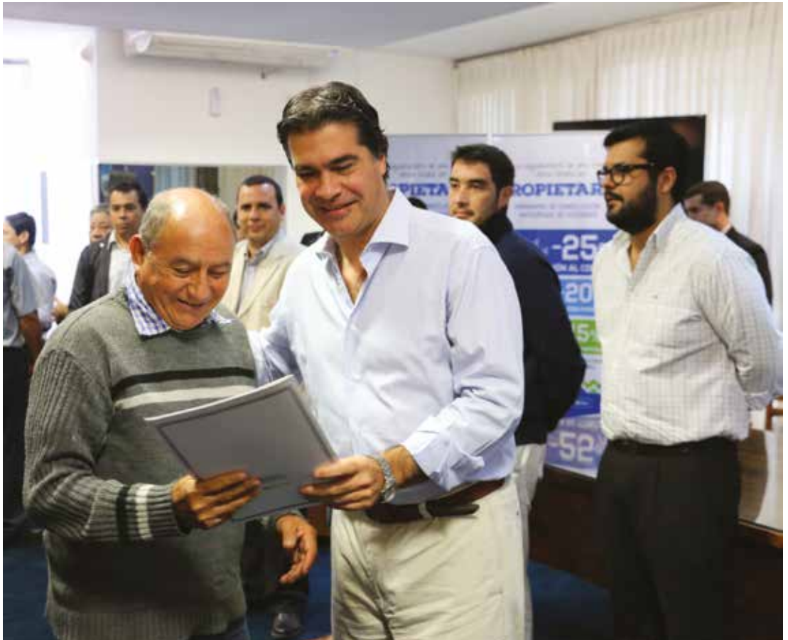
▲ El gobernador Capitanich entrega título de propiedad,

En ocho años de gestión provincial se alcanzarán los 30.000 títulos de propiedad entregados a adjudicatarios de viviendas en todo el Chaco y se superaron los $ 10 millones en el recupero de cuotas.