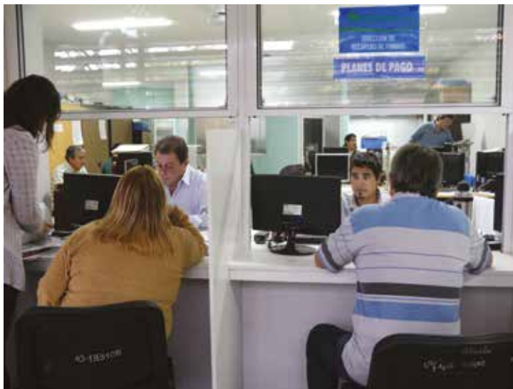
▲ Atención de Recupero de Fondos del IPDUV.