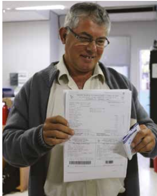
◀ Beneficiarios Programa Propietario.

la vivienda, proporcionando bonificaciones del 25%, 20% y 15% pagando al contado, en 6 o 12 cuotas respectivamente.