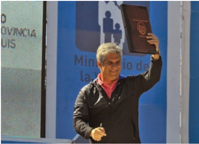
◀ El gobernador Poggi muestra feliz los decretos que inician 500 viviendas en San Luis