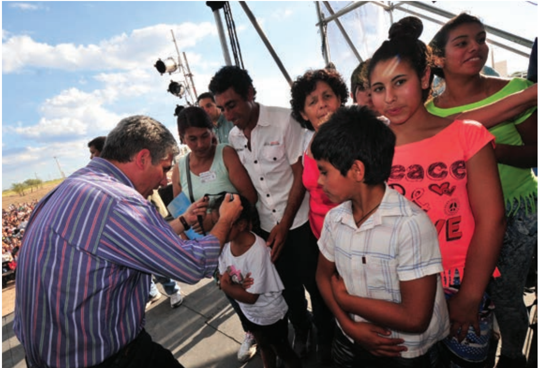
El más pequeño de la familia recibe las llaves de su casa nueva de manos del gobernador Poggi ▶

construcción, San Luis ocupa el 1° puesto entre las que más crecieron en la variación interanual, con un 18,3%. Lo que también mostró un crecimiento es la variación interanual de los salarios promedio registrados: un 23,5%.