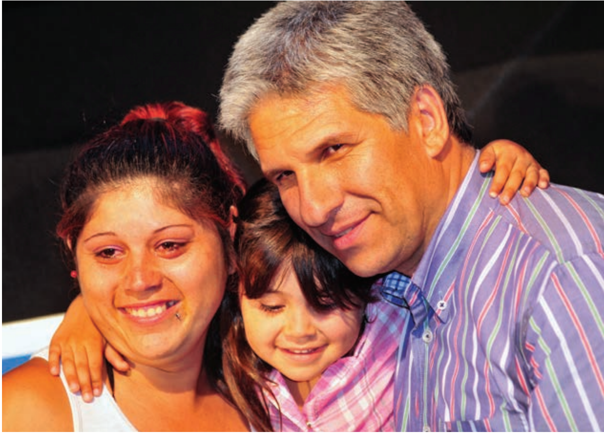
Una mamá soltera con su hija posan para la foto con el Gobernador y celebran por su casa propia ▶