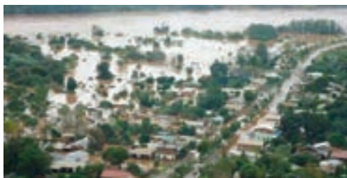
▲ ▼ Miles de hogares misioneros bajo el agua ▶

La provincia afronta la peor inundación de las últimas décadas, ya que la creciente del río Uruguay y sus afluentes, en la última semana de junio, fue mayor que la de 1983, y en daños materiales superó 20 veces el tornado de 2009.