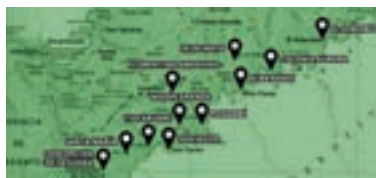
◀ Localidades misioneras afectadas por las inundaciones