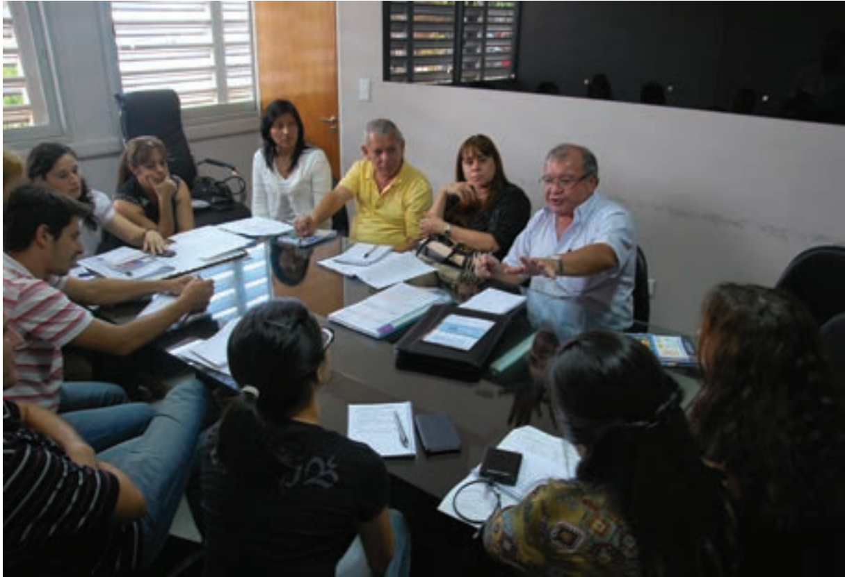
▲ Encuentro NEA sobre vivienda para discapitados: trabajo de equipos técnicos

con algún integrante con discapacidad y esto se ha cumplimentado ciertamente, esta gestión no llega a abordar de manera efectiva la inclusión total.