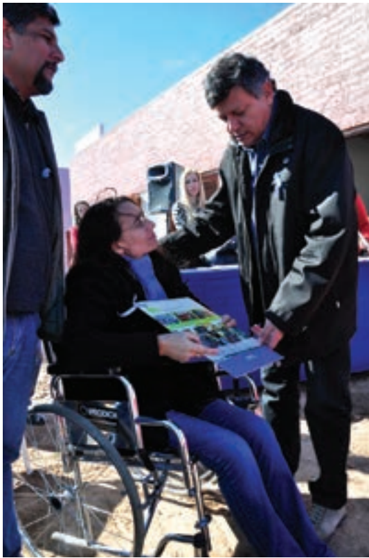
▲ Entrega de vivienda para discapacitados ▶