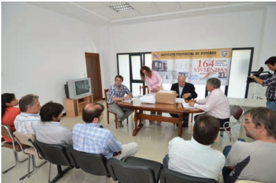
Apertura de sobres para Licitación ▲

El Gobierno de la provincia, a través del Instituto Provincial de Vivienda, ya realizó la apertura de sobres para la construcción de 164 viviendas en la Urbanización Malvinas Argentinas de la ciudad de Río Grande y de 116 viviendas en la Urbanización Río Pipo de la ciudad de Ushuaia.