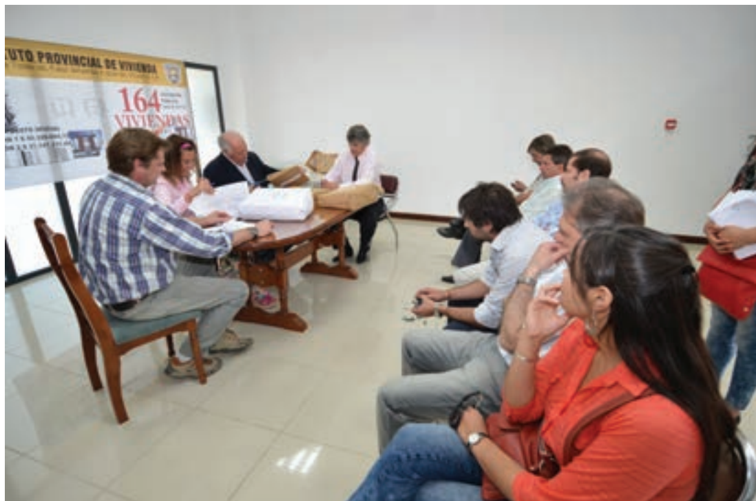
Apertura de sobres para Licitación ▲

Las viviendas que se construirán en la Urbanización Río Pipo son 110 dúplex y 6 viviendas adaptadas para personas con discapacidad motriz, con sus obras exteriores y complementarias.