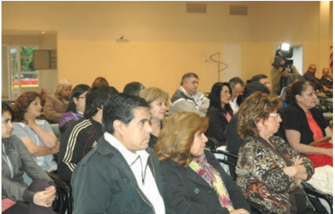
Acto entrega ▶ de Escrituras ▼