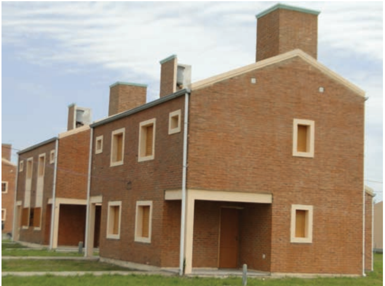
Viviendas dúplex, Barrio Nueva Formosa ▲

La posibilidad de que el novedoso y transparente sistema de sorteo se vaya extendiendo al interior provincial es bien concreta y depende de poder activar la sistematización de la información en toda la provincia y contar con recursos humanos especializados.