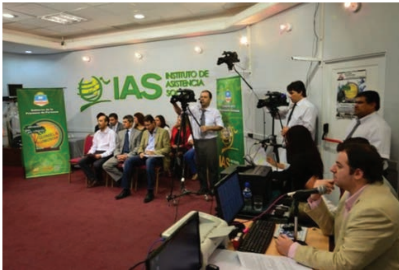
▲ Momento del 1º sorteo de viviendas en el IAS