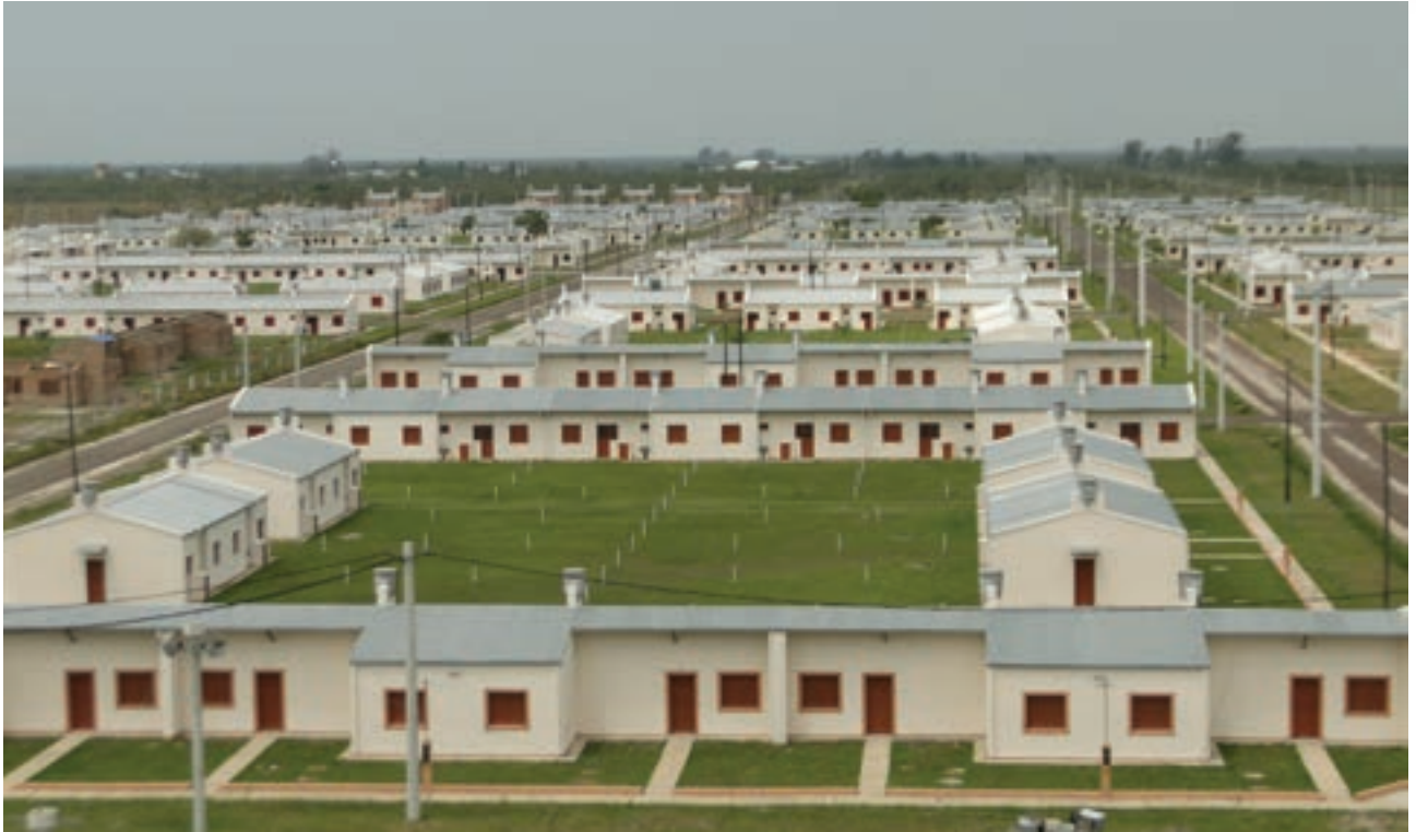
▲ Viviendas del Barrio Nueva Formosa, vista aérea

así también la reinversión del recupero de los pagos de las cuotas de las viviendas.