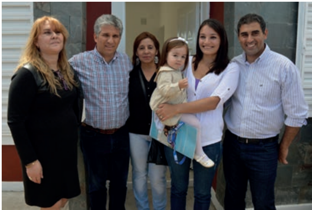
▲ El gobernador Claudio Poggi y el ministro Gastón Hissa, junto a las flamantes beneficiarias de una vivienda del Plan Progreso.

viendas de los distintos planes habitacionales, con lo cual la histórica cuenta provincial alcanza las 57.801 viviendas adjudicadas. El propio jefe de Estado resumió esta nueva etapa de la política habitacional con la premisa que fijara el día en que asumió: "Cada uno de los inscriptos tendrá su casa propia".