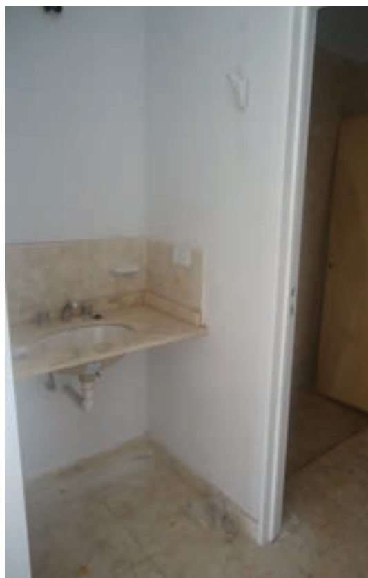
Sanitarios Ferrum - Cerámicos de primera calidad ▼