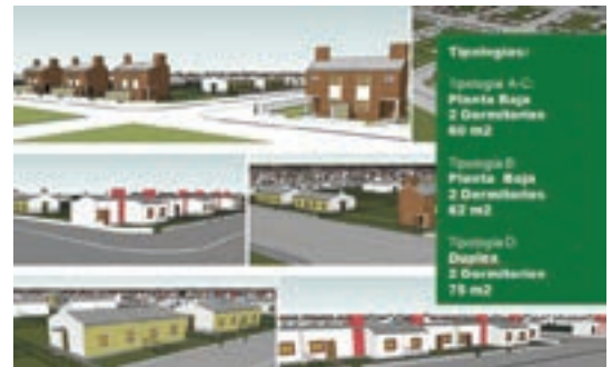
▲ Tipos de construcción del Barrio Nueva Formosa

En el acto de habilitación de estas obras, y recordando aquella trágica jornada de 2010, el gobernador Gildo Insfrán dijo: "Bienvenidas sean las nuevas escuelas, los nuevos barrios de viviendas y todas las