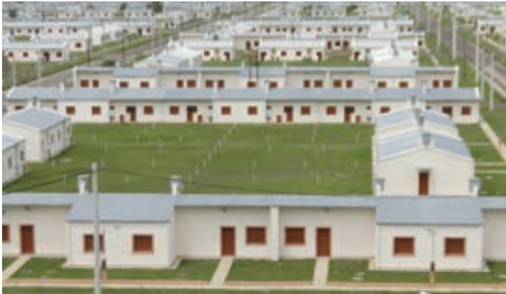
▲ Vivienda tipología C, frente a subestación transformadora de energía. Nueva Formosa