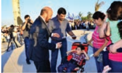
▲ Gildo Insfran entregando títulos de viviendas a propietarios del Barrio Nueva Formosa