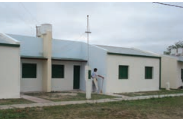
Viviendas 2 dormitorios. Pozo del Tigre ▲ ▼