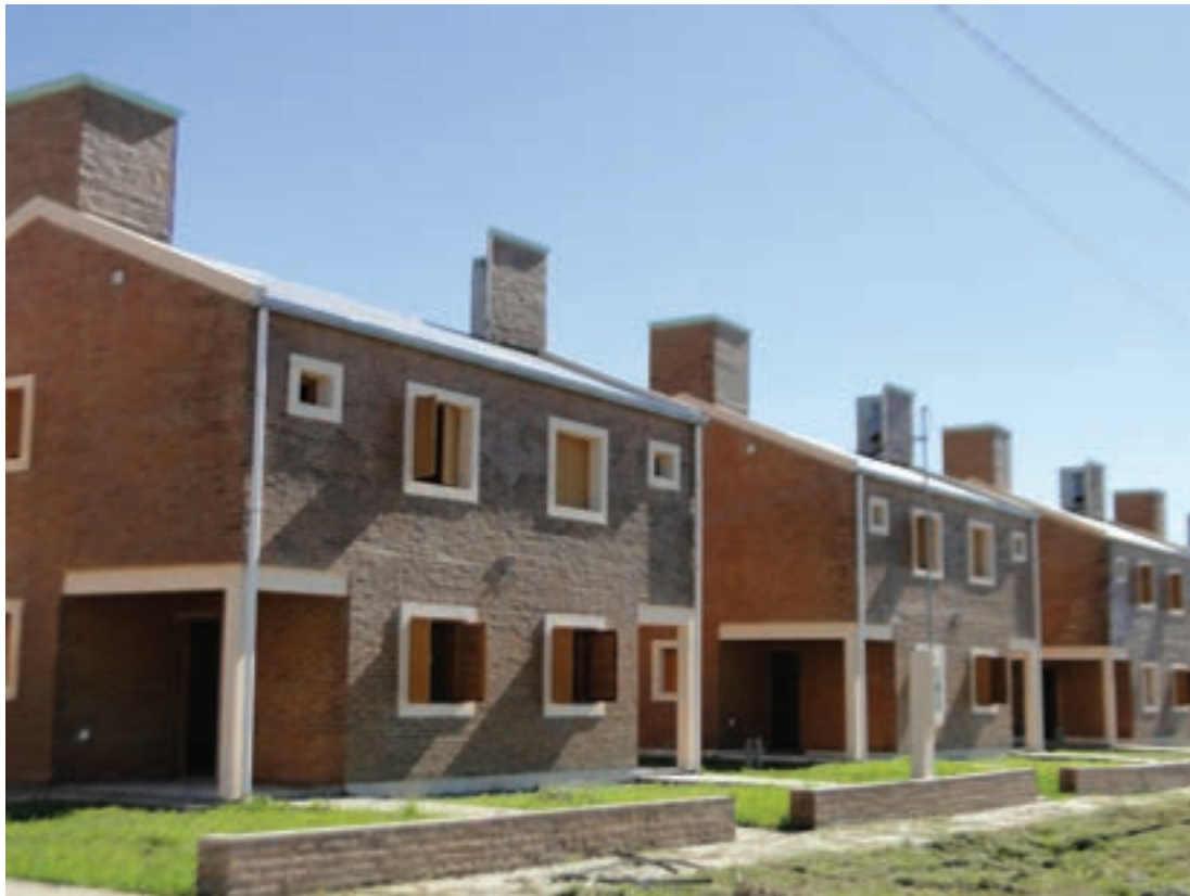
▲ Viviendas tipología D dúplex. Nueva Formosa

tales como redes maestras de agua potable, tanque y cisterna, centro de distribución eléctrica, redes de media tensión y subestaciones transformadoras, red de drenajes internos y sus cuencas externas, red cloacal con estaciones elevadoras y planta de tratamiento de líquidos, pavimento de acceso al barrio y avenidas con plazoletas, etc. De manera sintética, en infraestructura ejecutada se pueden señalar el pavimento de hormigón armado de acceso por la Av. Néstor Kirchner, boulevard, apertura y enripiado de calles con la iluminación completa en toda la extensión de estas circulaciones.