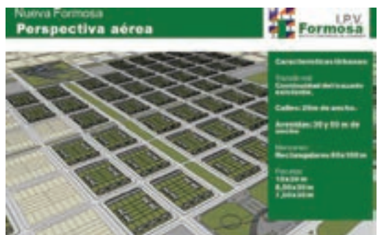
▲ Perspectiva aérea con avenida Interna Nueva Formosa

obras construidas para restablecer la totalidad de los servicios, para que se normalice la vida de los pobladores damnificados. A menos de tres años de aquel trágico tornado que destruyó más del 80% de esta comunidad y parajes cercanos, nuestro gobierno cumplió con su compromiso y mucho más. Reconstruyó y modernizó totalmente la localidad, con un impresionante plan de obras en todos los sectores que le ha dado una nueva fisonomía al pueblo, y a los habitantes les renovó la alegría y la fe tras