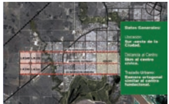
▲ Inserción Urbana Barrio Nueva Formosa