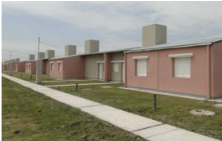
Viviendas 2 dormitorios. Nueva Formosa ▶