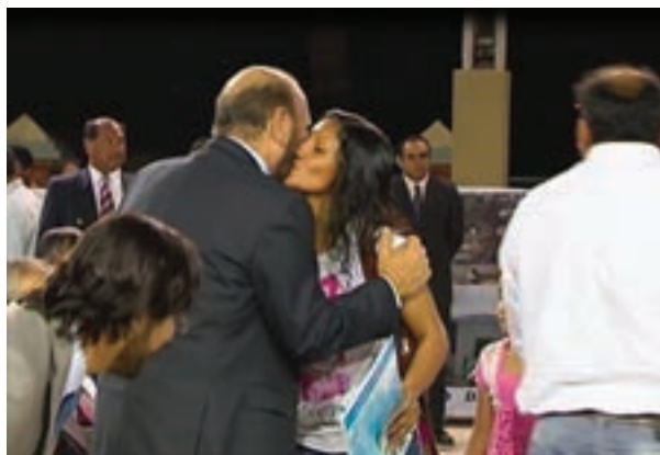
▲ El gobernador Gildo Insfrán entrega títulos de viviendas en Pozo del Tigre