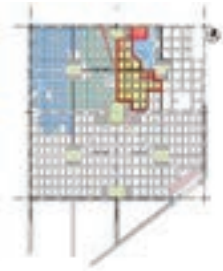
▲ Sector 1º etapa de entrega de 485 viviendas Nueva Formosa

Propietarios mudándose al otro día de la inauguración Nueva Formosa ▼