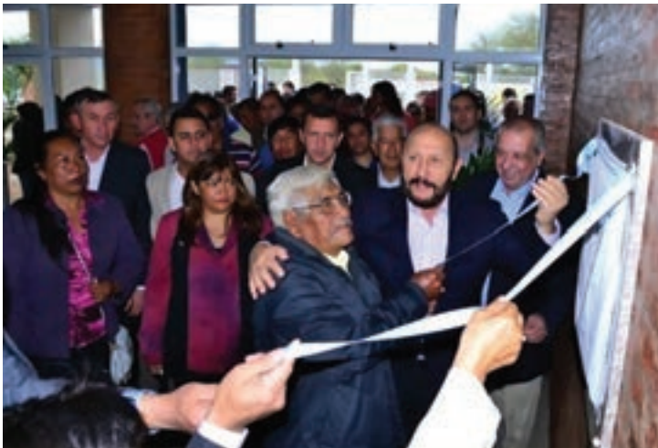
▲ Acto refundación, Pozo del Tigre

Propietarios mudándose al otro día de la inauguración Nueva Formosa ▼