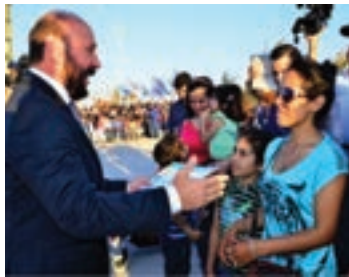
▲ Otro aspecto del Acto, Insfran entregando viviendas en Nueva Formosa

de nuevos hogares, aprovechando el momento para evocar el 8 de octubre como un nuevo aniversario del nacimiento del general Perón y el fallecimiento de Ernesto "Che" Guevara.