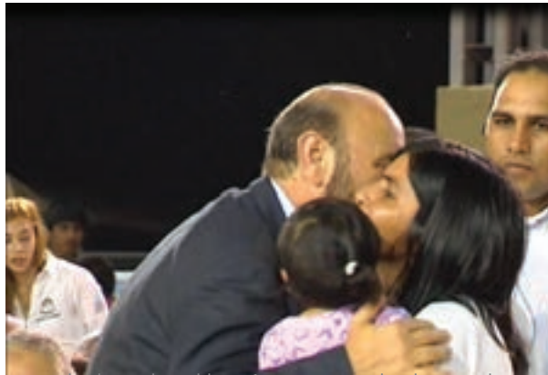
▲ El gobernador Gildo Insfrán entrega títulos de viviendas en Pozo del Tigre