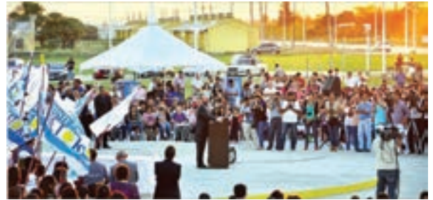
▲ Gobernador en Acto Central entrega viviendas Nueva Formosa