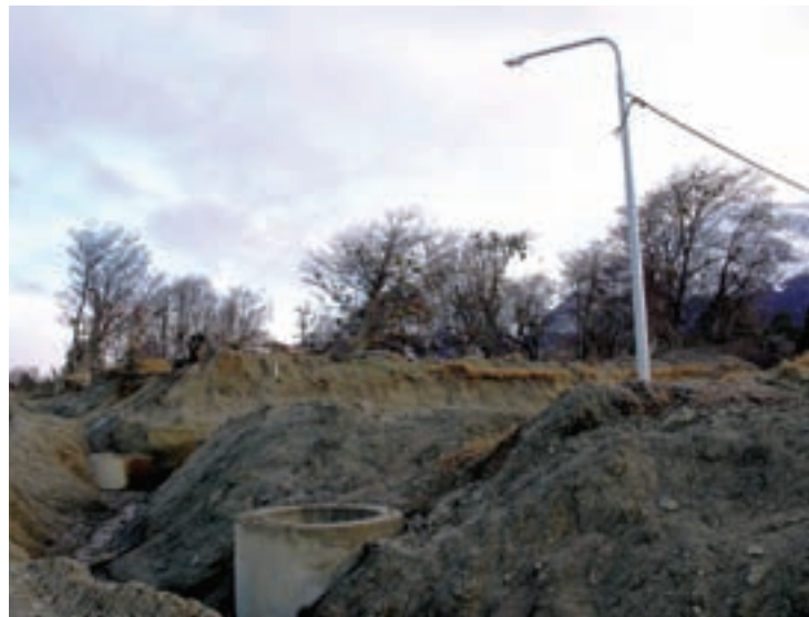
Obras de infraestructura ▲ ▼

El presidente del IPV dio a conocer que "este puente que va a ir en ese lugar ya está acá en Tierra del Fuego; es un puente bailey construido por el Ejército. Terminamos de resolver con la gente de Hidráulica la ubicación por las correntadas del río, así que estimamos que en breve llamaremos a licitación para su emplazamiento, y debe estar en el orden de los 30 a 60 días el llamado a licitación para la ejecución de esa obra". ◉