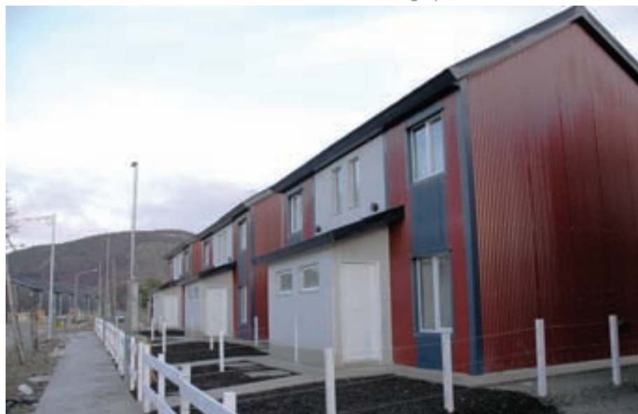
▼ Viviendas a entregar próximamente