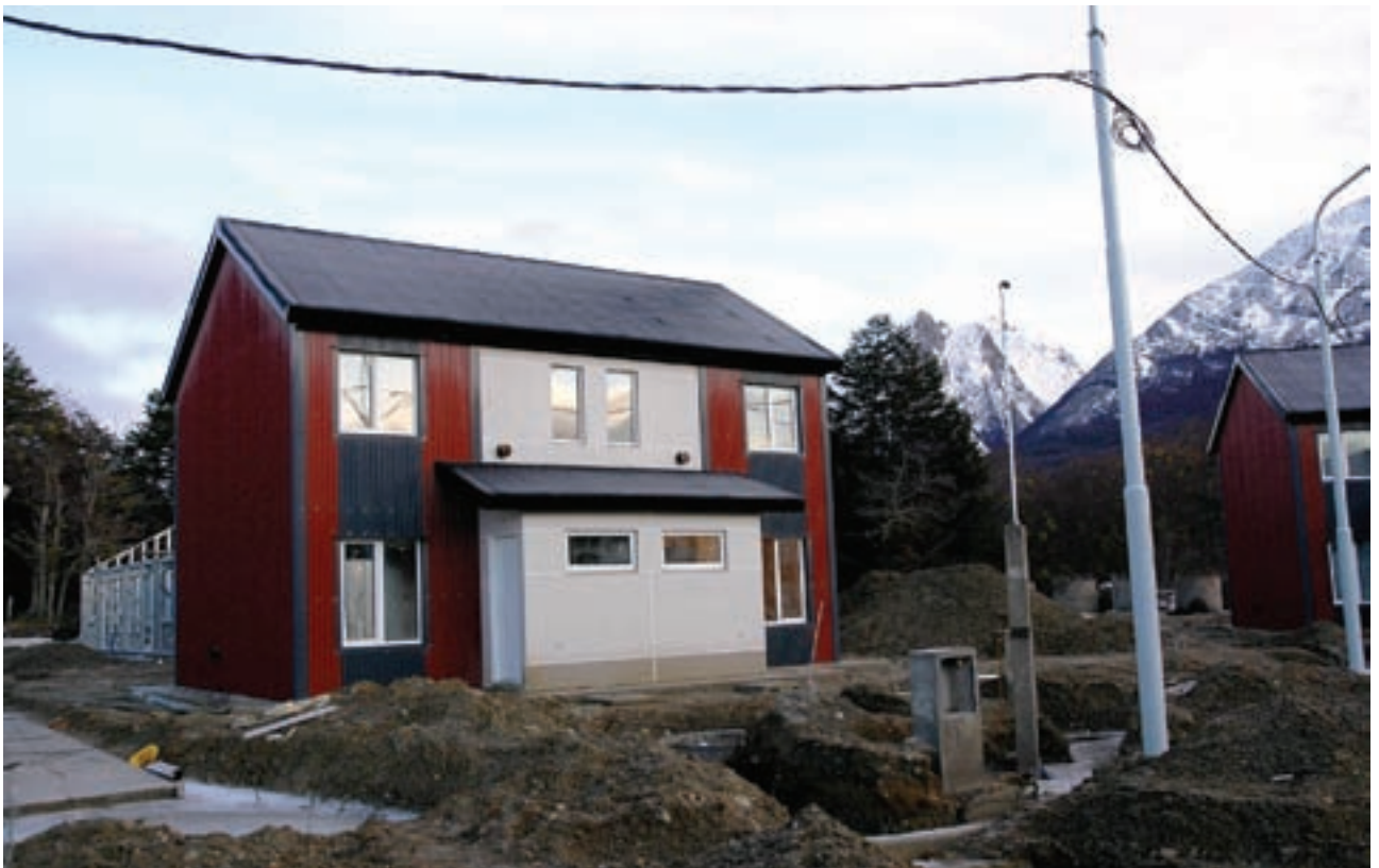
▲ Viviendas a entregar próximamente

Desde el Gobierno de la provincia, a través del Instituto Provincial de Vivienda, se continúa trabajando arduamente en el sector conocido como Urbanización Río Pipo de la ciudad de Ushuaia, a la vez que se siguen proyectando obras para la expansión de éste.