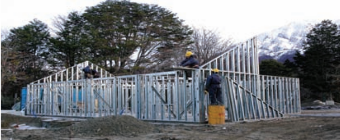
Viviendas en construcción ▲