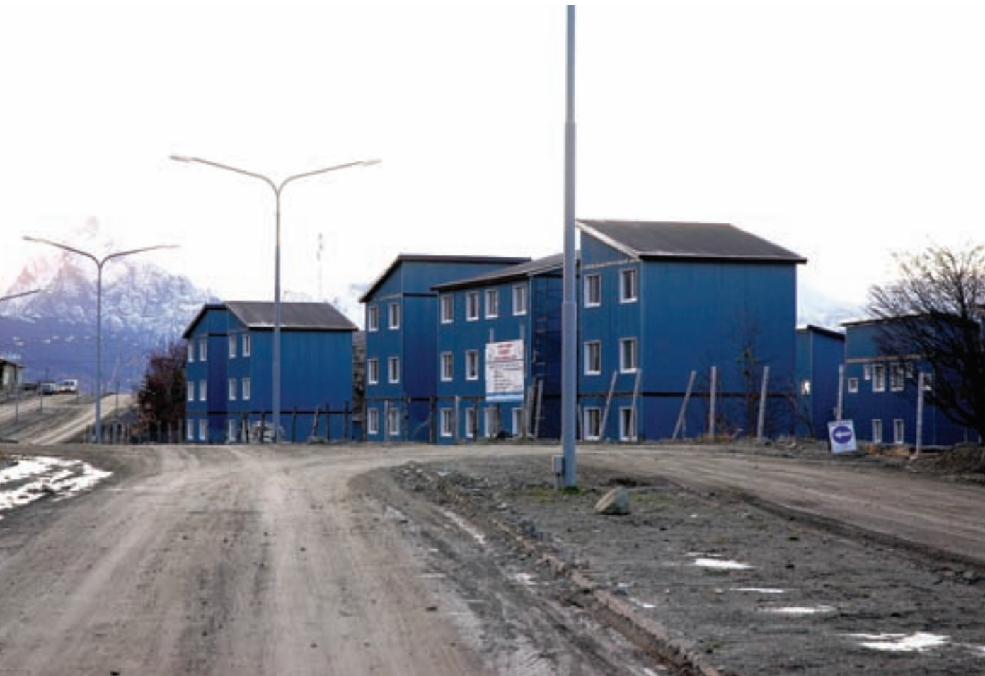
▲ Viviendas en construcción