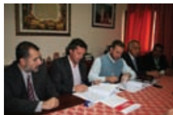
Firma de convenio en Metán ▲