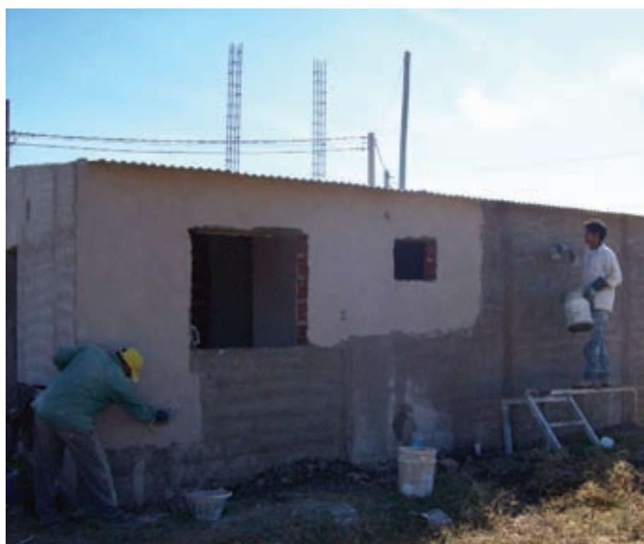
Las Lajitas ▲

Por otra parte, las intendencias se encargan de la ejecución de los trabajos mediante la dirección técnica, mano de obra, aporte de materiales y verificación de la correcta ejecución de las tareas.