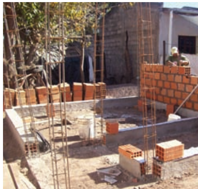
▲ El Quebrachal