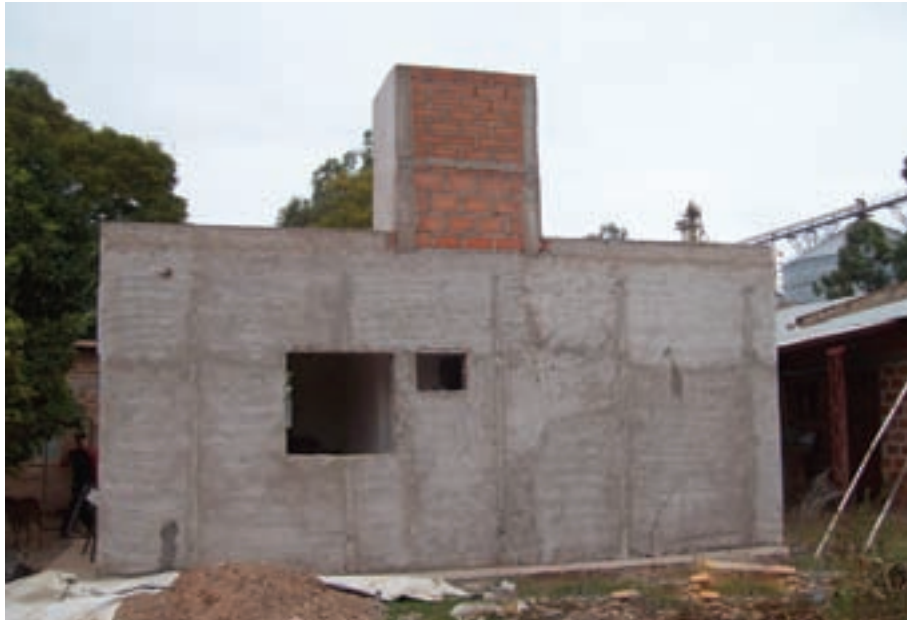
Las Lajitas ▼ ▲