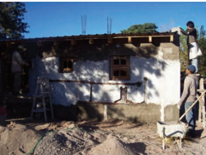
El Galpón ▲