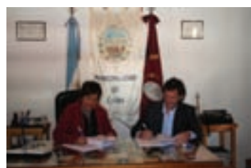
Firma de convenio en Cachi ▲