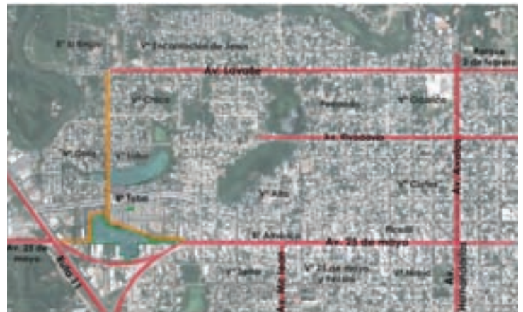
Conectividad con la ciudad ▲

Además, se concretará la relocalización de familias, trabajo en los terrenos y otras tareas que permitirán avanzar en soluciones definitivas para las