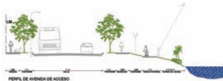
Conectividad con la ciudad ▲

diversas problemáticas del barrio. En total, la inversión que la provincia destinará a la implementación de este plan asciende a cerca de $100 millones, en