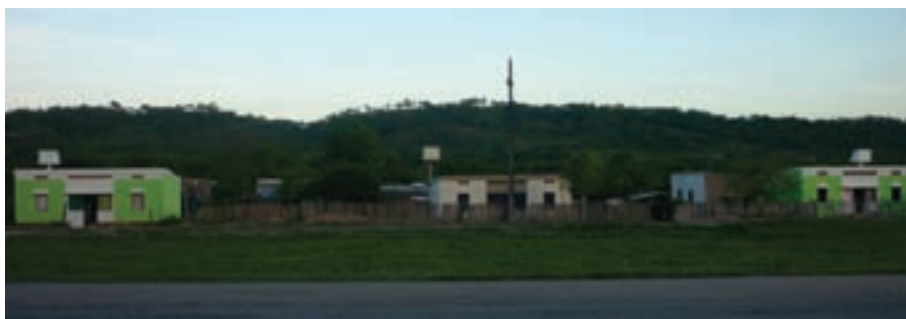
▼ Comunidad Guaraní – Salvador Mazza

En zonas de frío nocturno intenso y asoleamiento diurno, se construye con adobe, siendo éste el material adecuado desde el punto de vista del confort térmico de las habitaciones. Se utilizan zócalos de piedras del lugar, para protegerlos de la humedad del terreno.