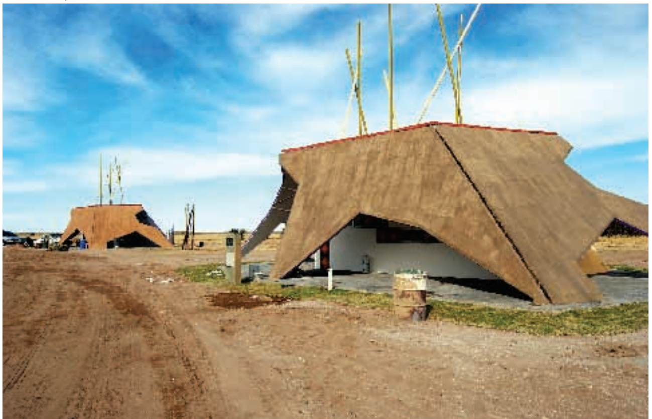
▼ Casa Ranquel 2

Producto de respetar y administrar eficientemente el presupuesto anual por tantos años es que San Luis muestra orgullosa logros como tener el 40% de las autopistas de toda la Argentina, una obra hídrica considerada entre las más importantes de Sudamérica (con 16 diques), la creación de la primera ciudad del siglo XXI denominada 'Ciudad de la Punta', con más de 5.000 viviendas, escuelas y hospitales, y tener los servicios de red de agua, cloacas en casi toda la provincia y gas natural en los principales centros urbanos. ◉