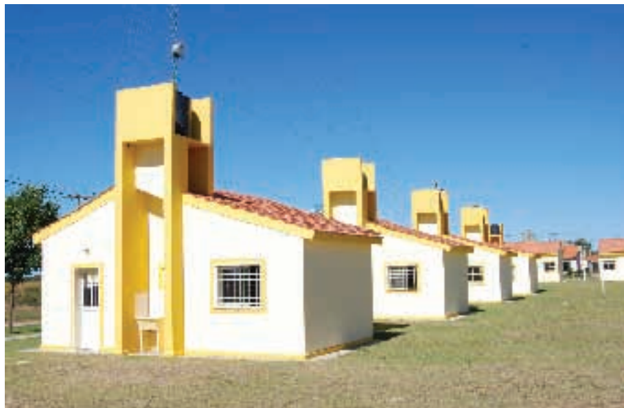
Viviendas sociales y Radicar Salud ▼

los profesionales de la salud buscan radicarse en grandes urbes, este plan tiene por objeto que los mismos se arraiguen a pequeñas localidades facilitando el acceso a la vivienda y, de esta forma, permitir que el profesional o técnico de la salud pueda desarrollar su familia en un hogar.