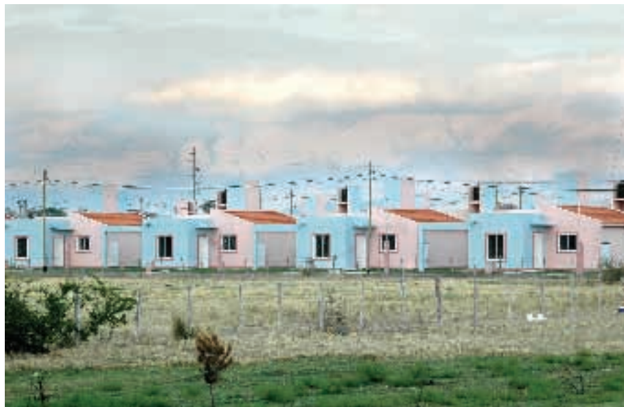
Viviendas sociales ▲

Plan Erradicación de Ranchos: siendo la autoridad de aplicación el Ministerio del Campo, consiste en reemplazar construcciones centenarias de adobe y deficien-