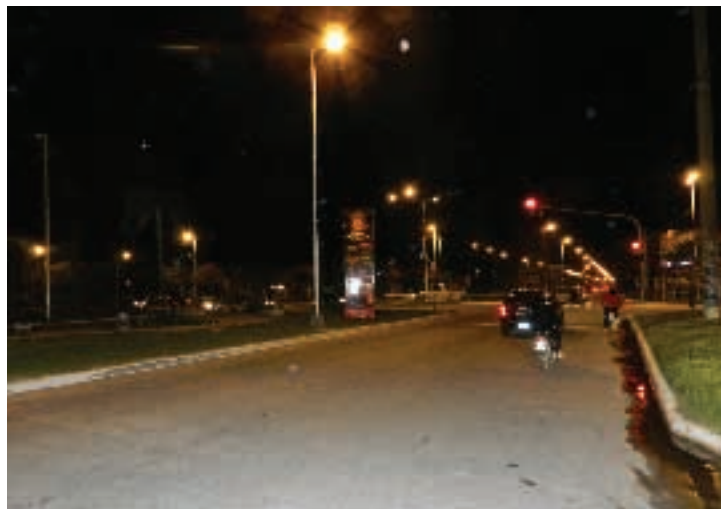
Av. Néstor Kirchner, imagen nocturna ▲