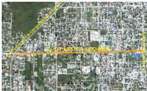
▲ Av. Kirchner, tramo habilitado