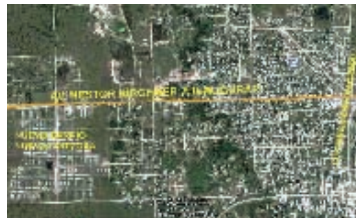
▲ Av. Kirchner, tramo a inaugurar

marcados en acciones coordinadas con otros estamentos del estado provincial, como el municipio, el SPAP, Infraestructura Eléctrica, Vialidad Provincial, la UPCA, el Ministerio de Desarrollo Humano y el Ministerio de Educación, entre otros organismos.