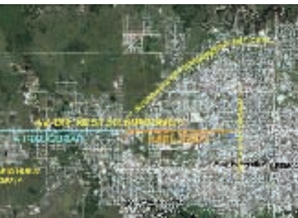
▲ Av. Kirchner, trayectoria completa