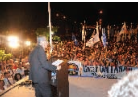
▲ Arq. De Vido hablando al pueblo