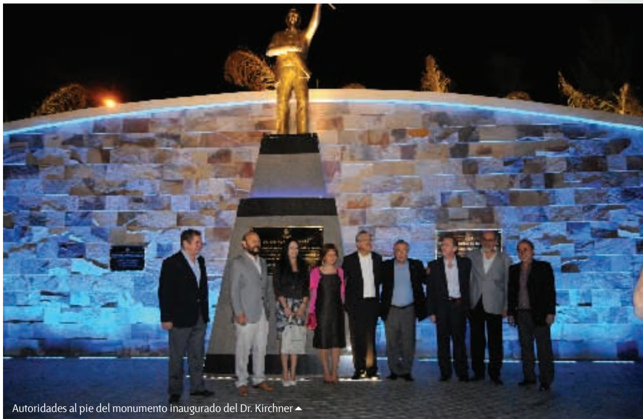
▲ Autoridades al pie del monumento inaugurado del Dr. Kirchner ▲