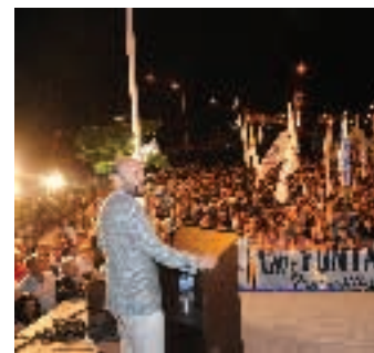
▲ Gobernador Insfrán hablando al público