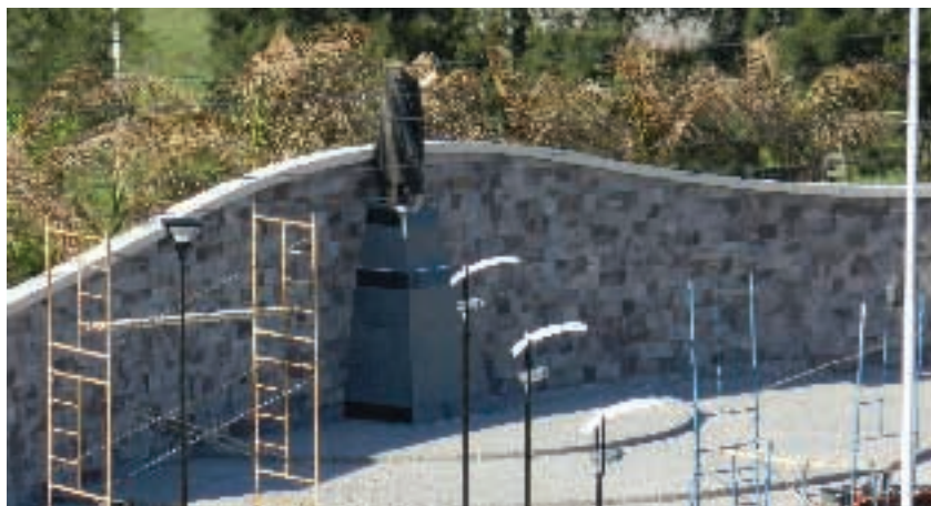
▲ Monumento al Dr. Néstor Kirchner