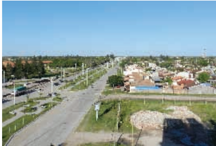
Av. Néstor Kirchner, vista durante el día ▲

La ordenanza aprobada por el HCD de la municipalidad formoseña dando el nombre de "Dr. Néstor Kirchner" a la avenida entre otros fundamentos expresa que "interpreta plenamente el sentir del municipio y de los vecinos de la ciudad como un profundo y sentido homenaje a tan ilustre y querido ex dignatario, quien demostró a los formoseños el cumplimiento de la palabra empeñada y su profundo amor a la ciudad y a la provincia". Además "permitirá el cálido y permanente recuerdo para las generaciones futuras, hacia quien materializara tantos anhelos, logros y