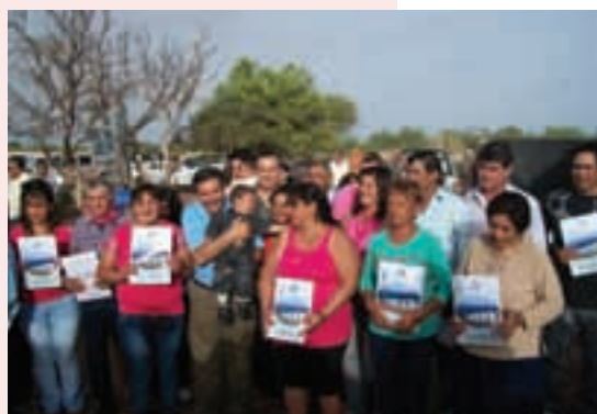
▲ Gobernador Luis Beder Herrera en entrega de viviendas

debe buscar mejorar la calidad de vida de las familias y abordar el desafío desde una mirada integral que contemple no sólo