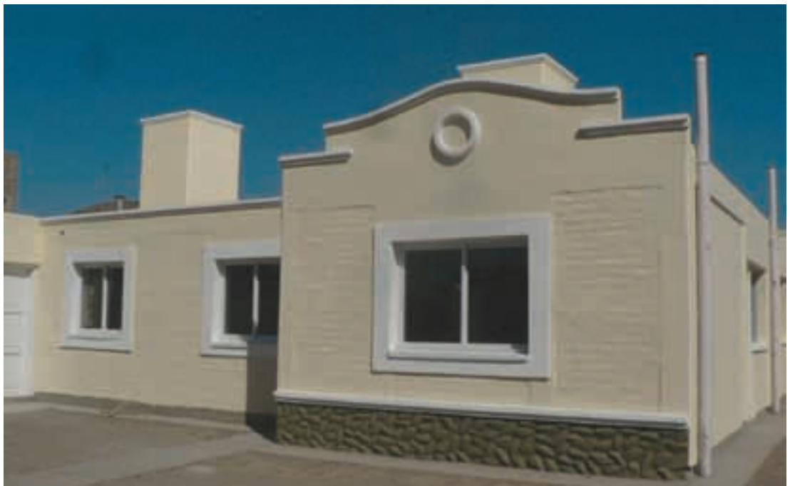
▲ Barrio Estado de Israel, Rawson.

Durante esta gestión se terminaron 2.824 viviendas, están en ejecución 770 y en proyecto 224 localizadas en distintos departamentos de la provincia.