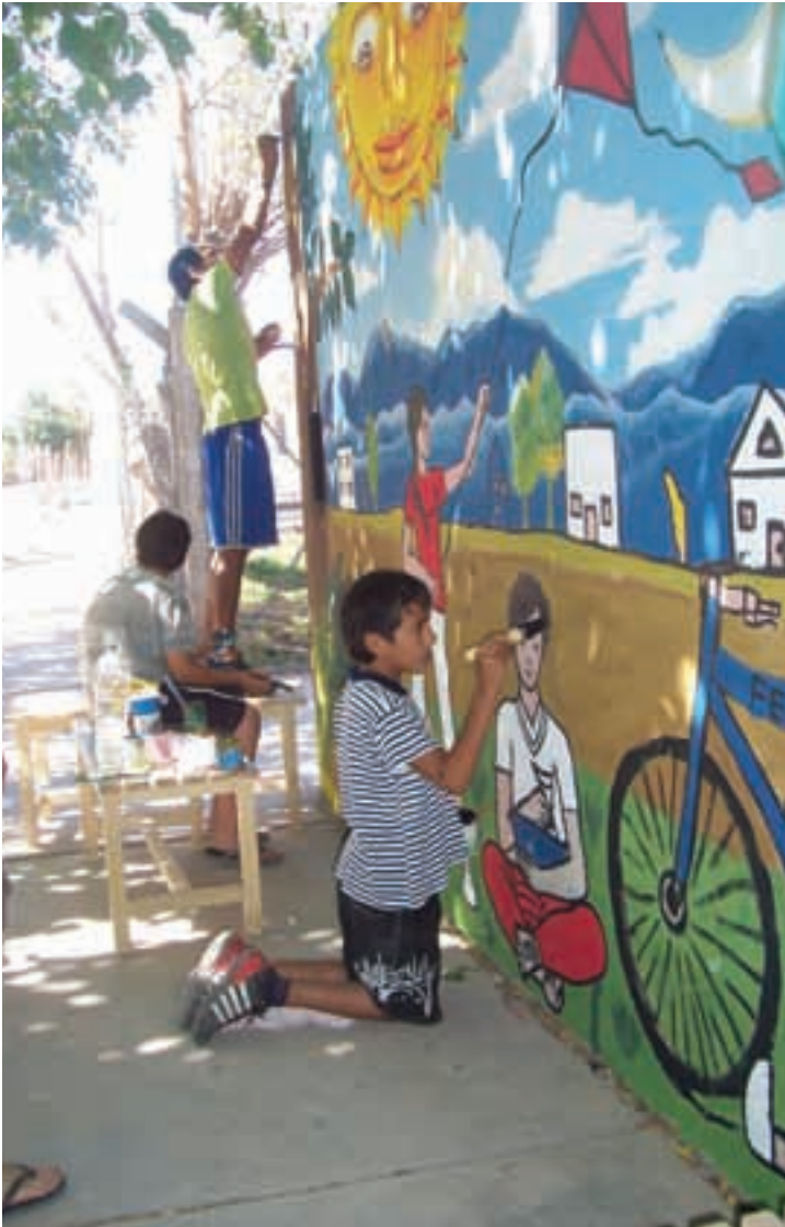
◀ Mural ejecutado en S.U.M. B° Gral. Acha -PROMEBA- en el marco del proyecto de fortalecimiento del “capital social humano” financiado con recursos BID-NACION.