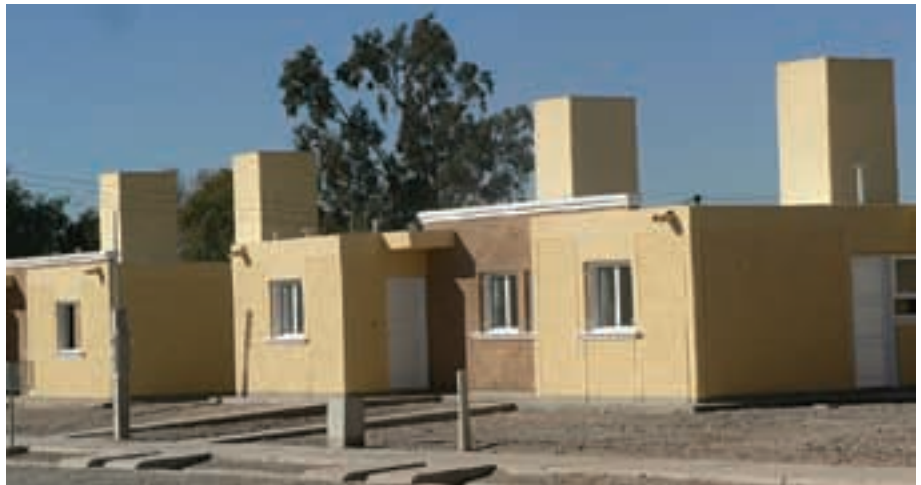
▲ Barrio Teresa de Calcuta – Plan Federal II

Una acción del Estado en busca del desarrollo urbano utilizando y concentrando todos los recursos disponibles (humanos, técnicos, administrativos y financieros) de la manera más eficaz para el cumplimiento de los objetivos propuestos.