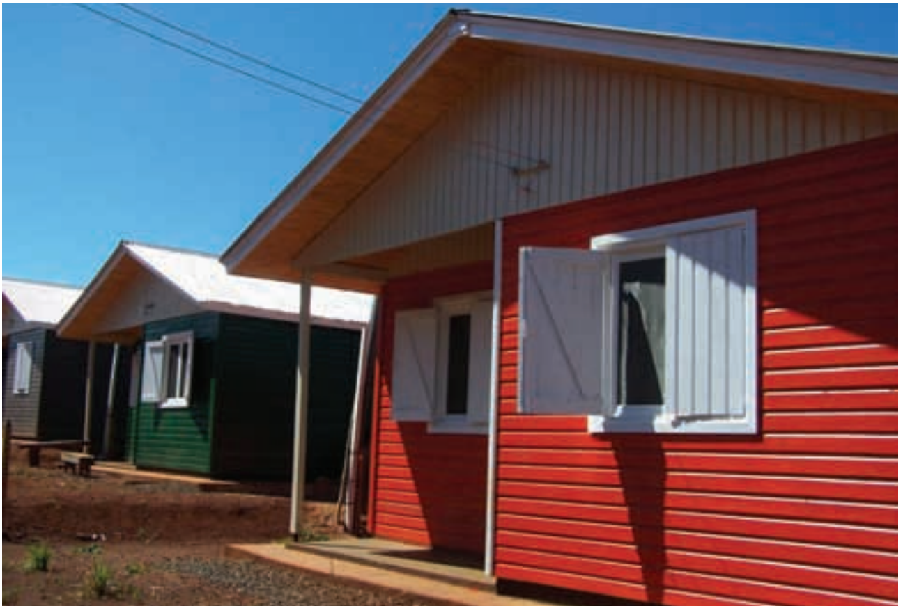
▲ Primer grupo de viviendas para tareferos entregadas el 23 de diciembre de 2009

La provincia de Misiones cuenta con una población total de 1.061.590 habitantes de los cuales 300.000 viven y producen en el ámbito rural. Este indicador ha variado a lo largo de la historia de acuerdo a los contextos económicos que se sucedieron; en algunas etapas incrementándose y en otras disminuyendo por el éxodo a las ciudades en busca de mejores oportunidades.