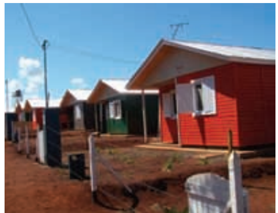
▲ Fachada frontal ▲ Nuevo barrio de viviendas tareferos en la localidad de San Ignacio

las familias rurales en construir una vivienda y por otro lado las consecuencias que trajo la crisis financiera al sector maderero) es que se optó por instrumentar esta política habitacional para que comprendiera ambas situaciones.