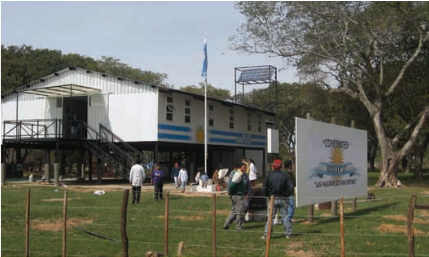
▲ Escuela rural N° 377 (isla el Talar), dotada de energía solar

A partir de la creación del INVICO en 1978 la búsqueda de respuestas al problema del déficit habitacional cobró entidad y permanencia en la agenda de las políticas públicas locales, instalándose luego en el imaginario popular que comenzaba a vislumbrar cuál era el camino más asequible para llegar a la vivienda digna.