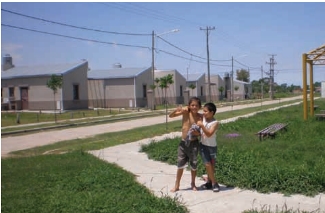
▲ Programa Federal Plurianual de Construcción de Viviendas - 300 Goya

INSTITUTO DE VIVIENDA DE CORRIENTES (INVICO)