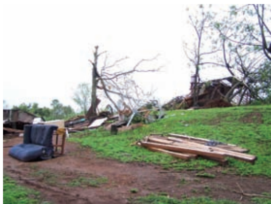
▲ Restos de viviendas en Tobuna, San Pedro

Fenómeno climático afectó a 790 viviendas, escuelas y dependencias de las localidades de San Pedro, Wanda, 9 de Julio, Puerto Libertad, Santiago de Liniers, Campo Viera y Puerto Esperanza.