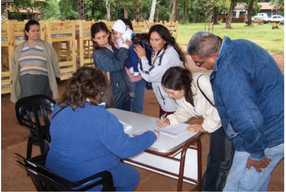
▲ Entrega de cuchetas y viviendas provisorias en Tobuna

Se completan el techado de la Escuela 342, 17 viviendas provisorias y 10 techos, y se entregan 150 cuchetas.