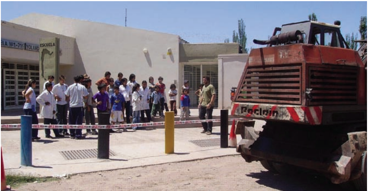
Taller de seguridad en obra barrio Nebot - Guaymallén ▲

La provincia de Mendoza no permanece ajena a la necesidad de integrar a los sectores excluidos y segregados por la pobreza, a la trama social y urbana mediante el acceso a infraestructura básica, viviendas dignas y programa de sustentabilidad.