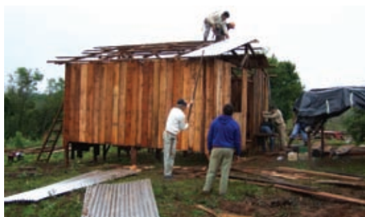
▲ Vista reconstrucción techos

Comenzaron los cambios de techos de viviendas y escuelas y la construcción de viviendas provisorias.