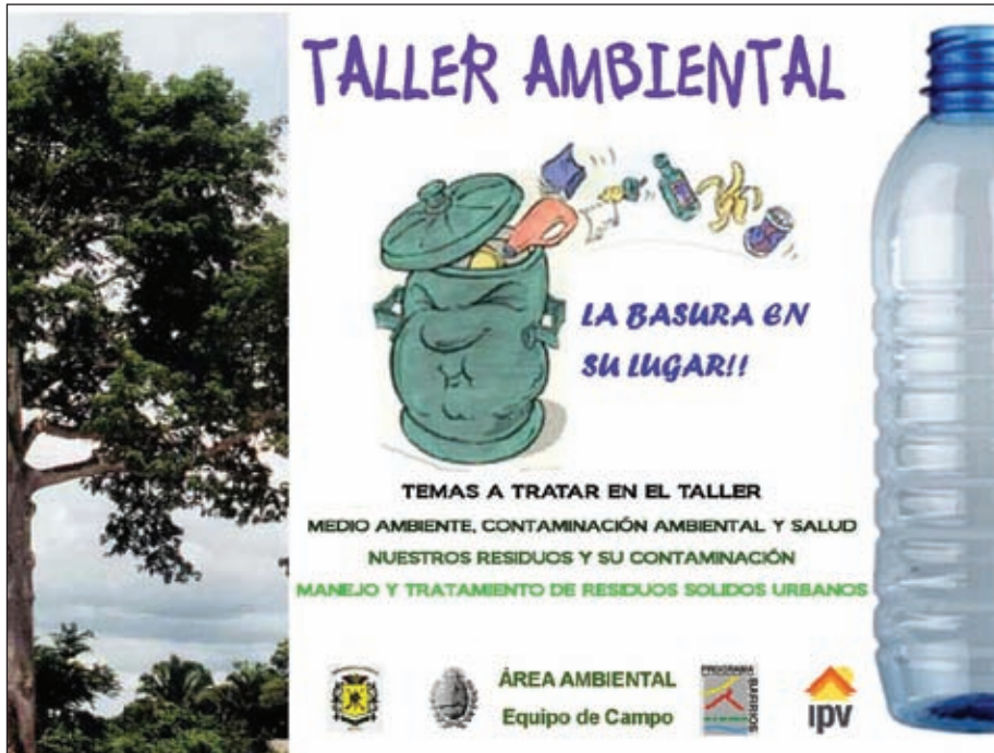
Folletería utilizada en un taller de residuos ▲

el tiempo. En efecto, las organizaciones acompañan la ejecución de las obras, controlan su calidad y celebran acuerdos para el uso y mantenimiento de los Salones Comunitarios (SUM) construidos. Cientos de actividades, reuniones, talleres, festivales y encuentros acompañan el desarrollo de las obras. Otras iniciativas de completamiento del hábitat son diseñadas y proyectadas por los vecinos con el apoyo de los profesionales (Proyectos de Iniciativas Comunitarias). Hemos priorizado el accionar conjunto con otros programas y proyectos del gobierno provincial desarrollando actividades que procuren la contención y prevención de riesgos en grupos vulnerables y la creación de redes de organizaciones que contribuyan al desarrollo local y sustentable a fin de mejorar efectivamente la calidad de vida de la población destinataria.