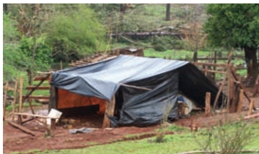
▲ Casas cubiertas con nylon como primera medida

Se cubrieron con nylon los hogares que mantuvieron las estructuras.