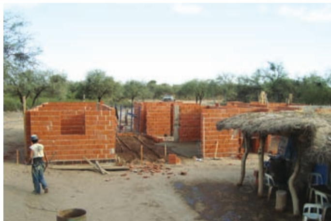
▲ Construcción de viviendas nuevas

y carpintería, así como también la instalación de baños y áreas de ducha. Por otro lado, resulta importante destacar que luego de la visita se determinó la necesidad de que las inspecciones de obra sean realizadas por dos profesionales que deberán viajar en forma conjunta dadas las malas condiciones de los caminos de acceso, la lejanía a los centros de abastecimiento y la falta de medios de comunicación.