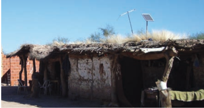
Vivienda-rancho con paredes de adobe y techos de paja ▲

la endemia, y teniendo en cuenta las habilidades y conocimientos empíricos de los pobladores, se optó por un sistema de construcción tradicional húmedo con cubierta liviana de chapa. Los muros serán de mampostería de bloques cerámicos y enlucida en ambas caras con revoques grueso y fino a fin de generar una superficie lisa. La cubierta de techo se realizará con estructura de tubos metálicos y placas de aglomerado fenolito que conformarán el cielorraso interior, creando una superficie continua y uniforme y rescatando la experiencia recogida de otros países que definen a la madera como el material que mejor se comporta para mantener el efecto residual de los agentes insecticidas que combaten a la vinchuca. Sobre el cielorraso de madera, que actúa como encofrado perdido, se ejecutará una capa de compresión de hormigón con agregado de perlas de polietileno expandido armado con mallas de acero. A la capa de compresión se le aplicará pintura de brea acuosa como aislamiento hidrófugo. La cubierta será de chapa ondulada sujeta a tubos metálicos con una pendiente que permita el escurrimiento de las aguas pluviales,