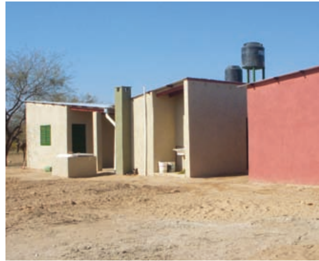
Viviendas construidas en forma tradicional con la galería como protagonista ▲