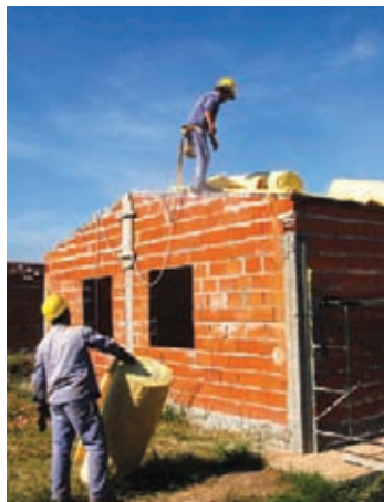
▲ ▼ Esteban Echeverría

INSTITUTO DE VIVIENDA DE LA PROVINCIA DE BUENOS AIRES