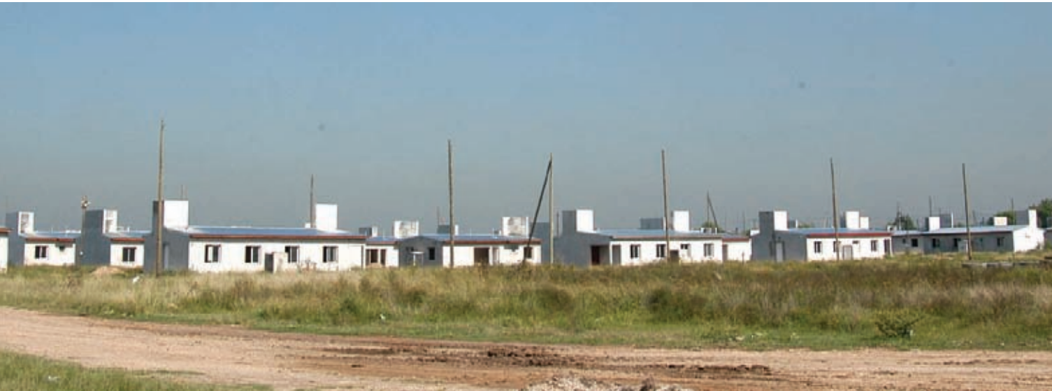
▲ Viviendas en Florencio Varela