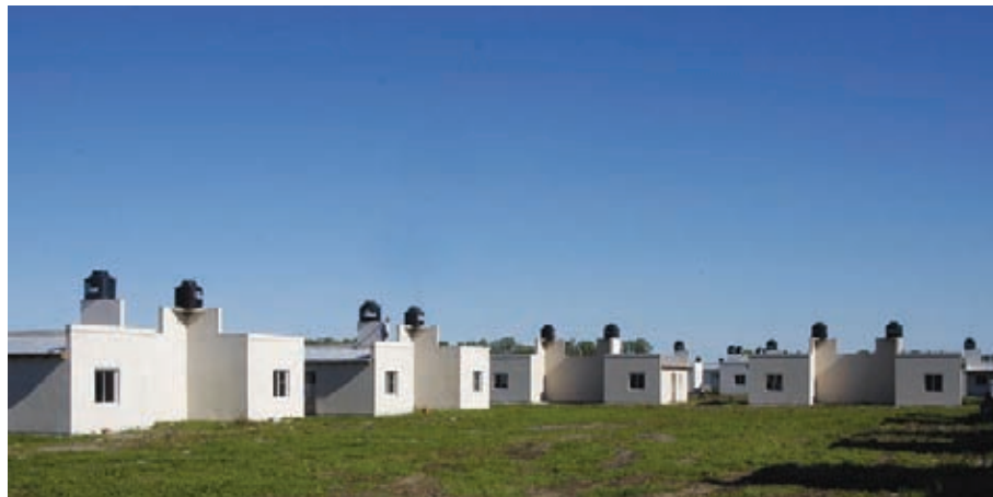
▲ Chascomus, 108 viviendas