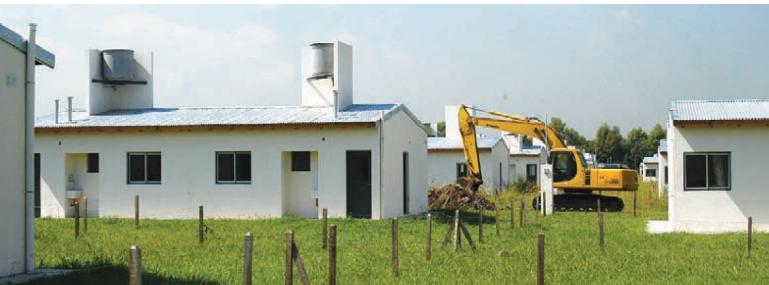
Viviendas en Florencio Varela ▲

La descentralización como lineamiento principal del Programa de Co-gestión conjunta entre el Instituto de la Vivienda y los municipios bonaerenses para el recupero de cuotas del Plan Federal de Viviendas.