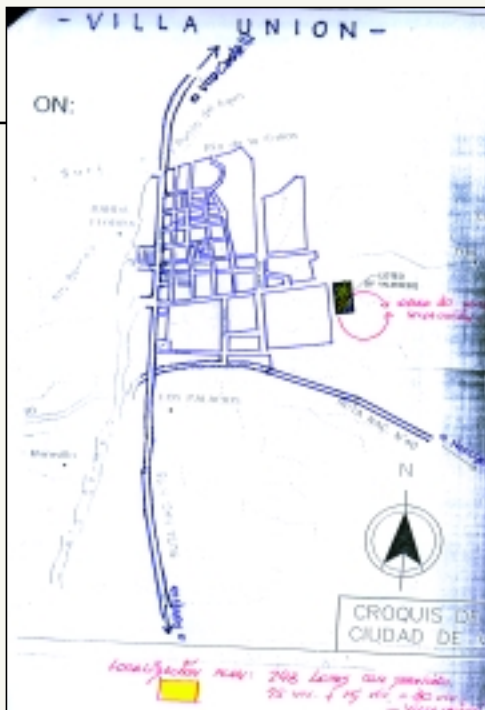
Fotos a julio 2003